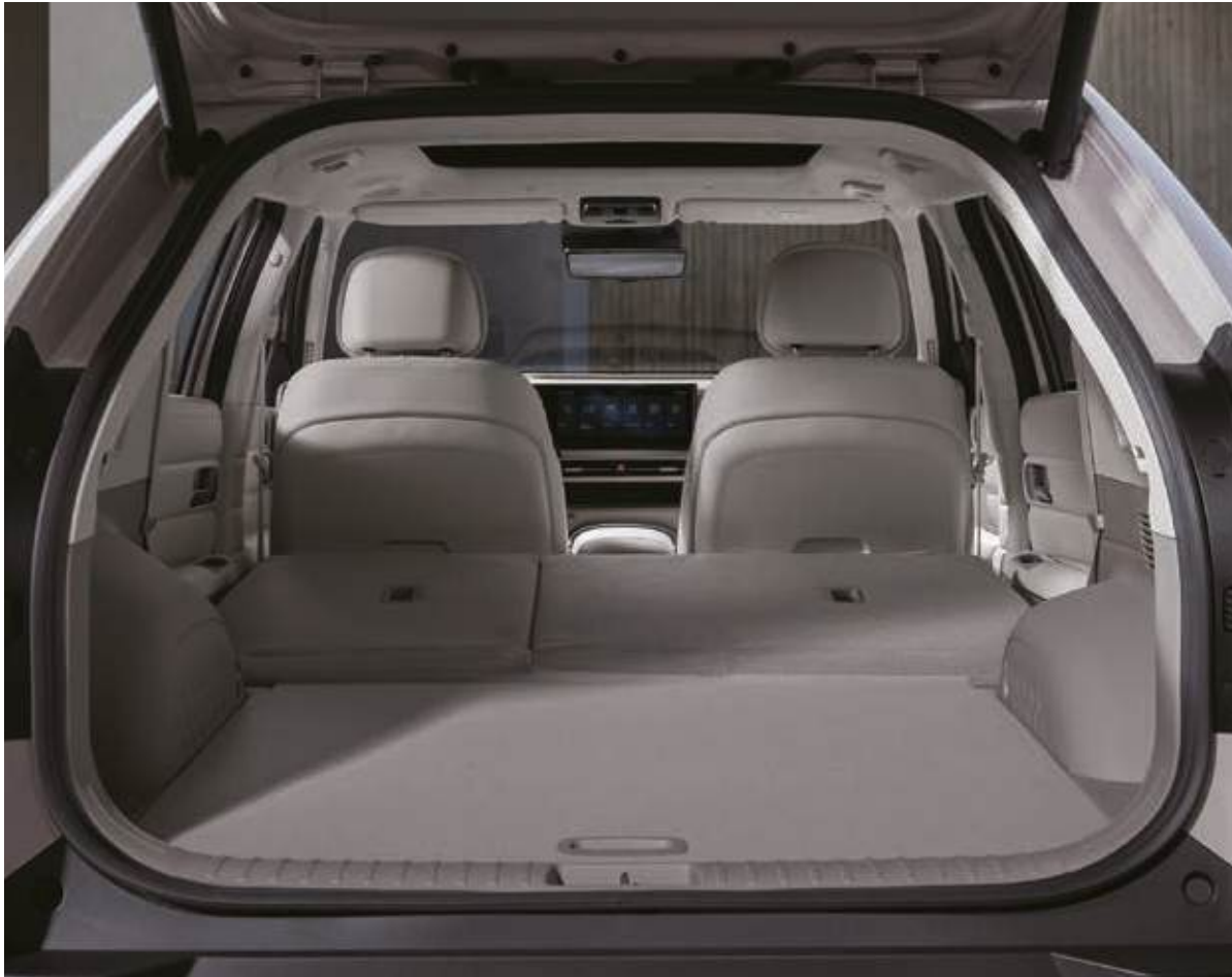
Espacio de carga: 510L / Máx 1.630L (segunda fila plegada) * Según los estándares VDA