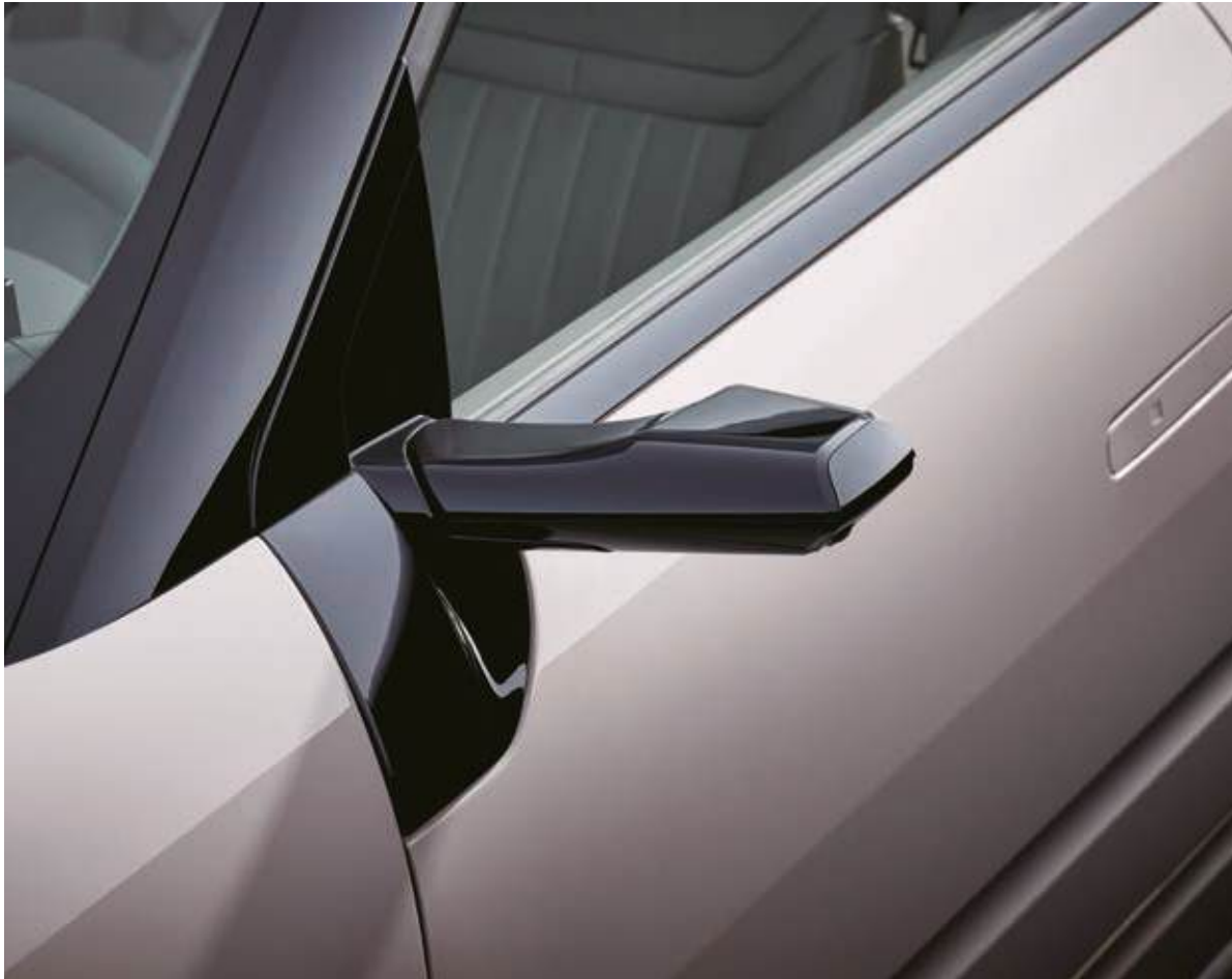
Retrovisor digital (DSM)

El nuevo NEXO, diseñado con unas líneas atrevidas y una estructura que proyecta confianza, acentúa aún más los patrones de líneas horizontales en las puertas, lo que le da una apariencia de fuerza inquebrantable.