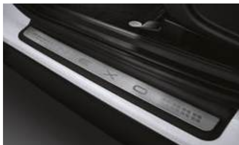
Placa protectora metálica para puertas