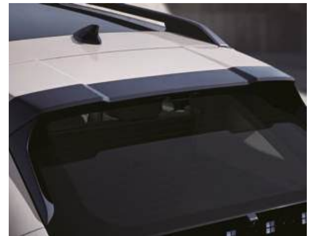
Luces traseras combinadas LED completas y luces de freno elevadas Alerón trasero