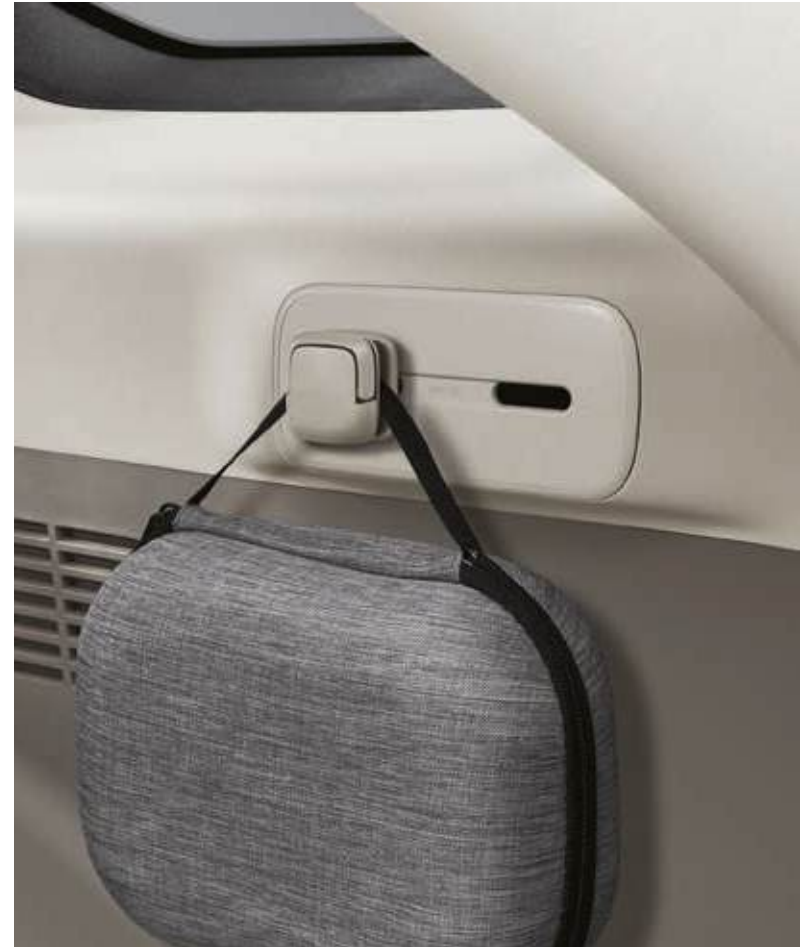
Soporte en zona de carga