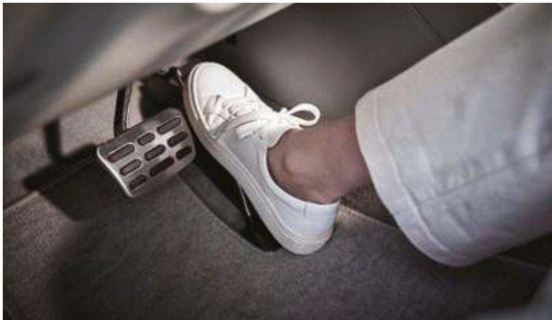
Sistema de supervisión de la conducción Asistente para evitar aceleraciones involuntarias