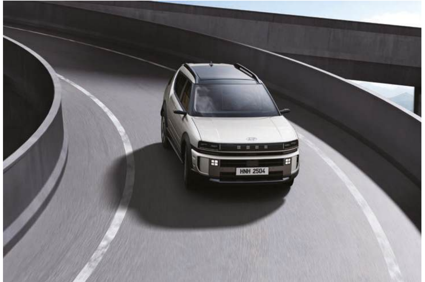
Control dinámico e-Handling