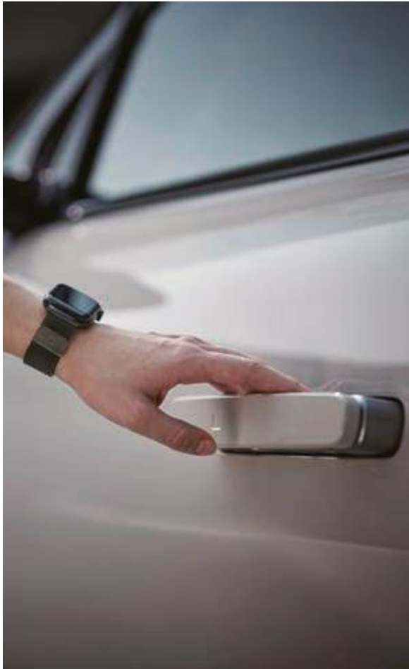
Llave digital 2.0