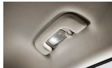
Luz interior tipo LED