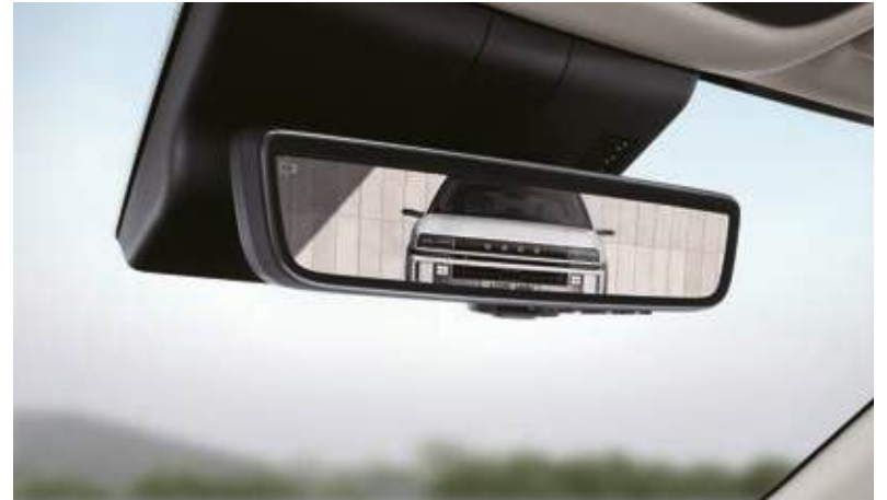
Retrovisor digital central (DCM)