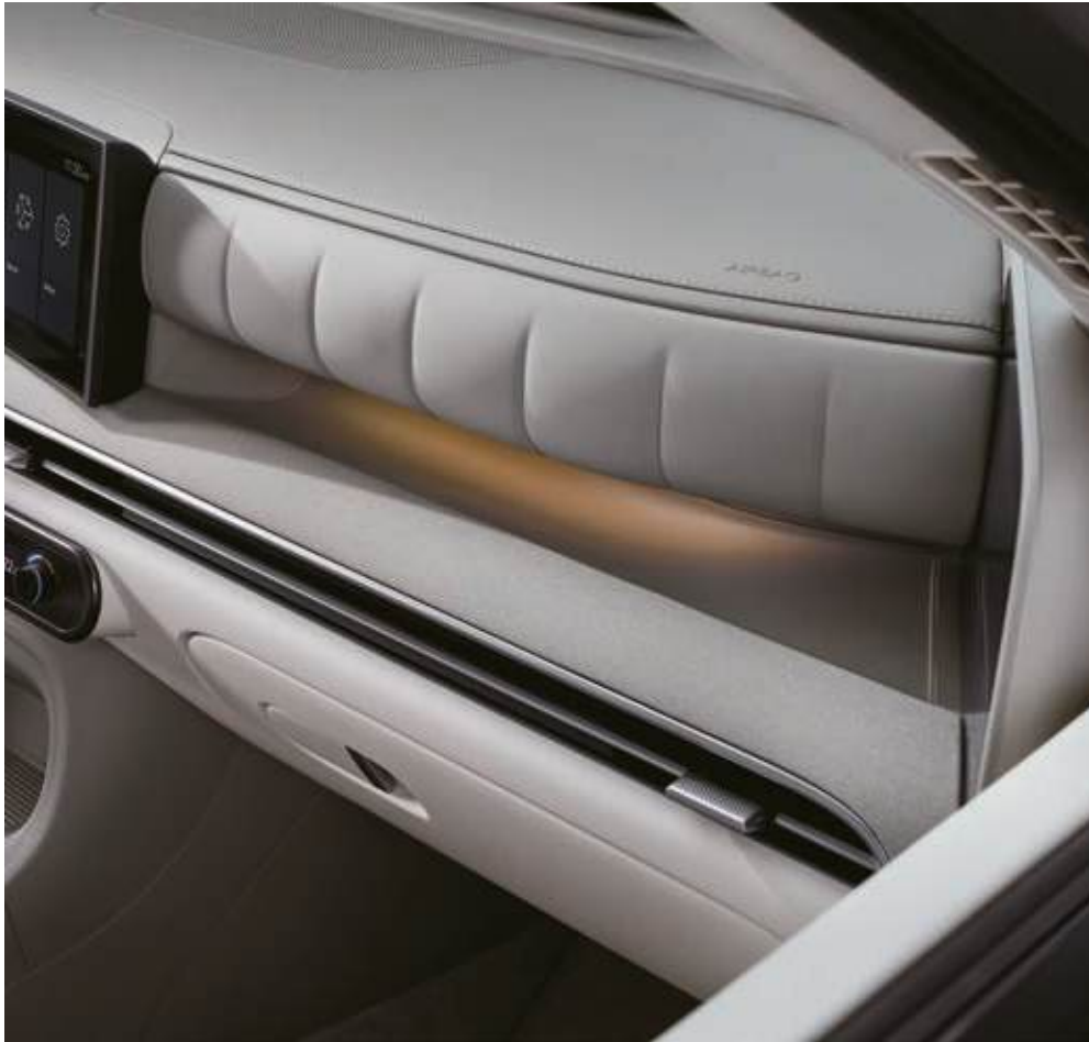
Bandeja abierta en el lado del pasajero