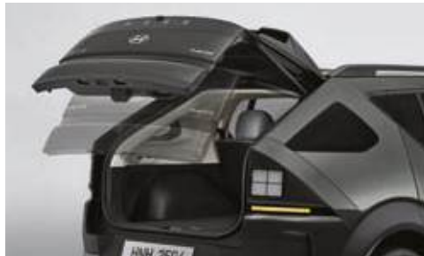
Portón trasero eléctrico inteligente