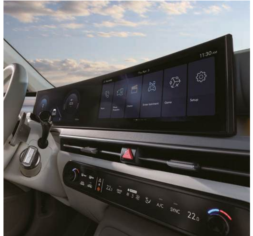
Dos pantallas de 12,3"