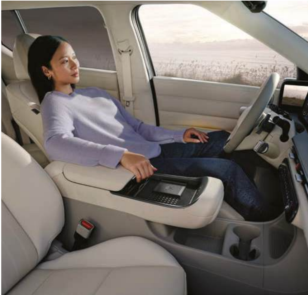
Cómodos asientos delanteros (con reposapiés)

Disfruta de un espacioso interior, perfecto para un estilo de vida relajado, y de sus cómodos asientos, el práctico espacio de almacenamiento y un maletero optimizado.