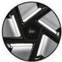
Llantas de aleación de 19 pulgadas