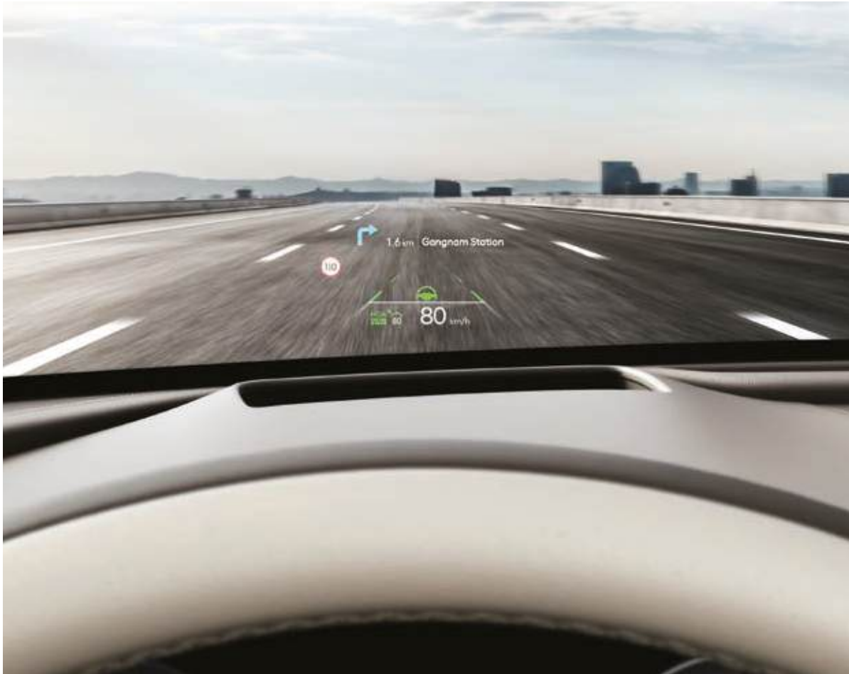
Head-up Display (HUD)