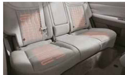
Asientos calefactados en la segunda fila