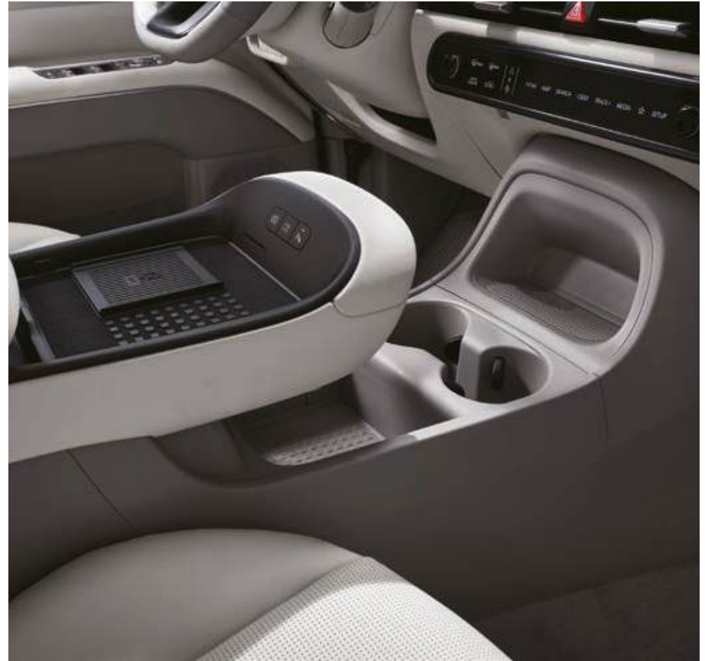
Bandeja y compartimento para el teléfono