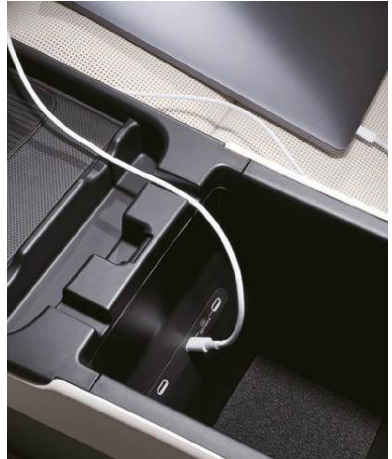
Puerto USB-C de 100W