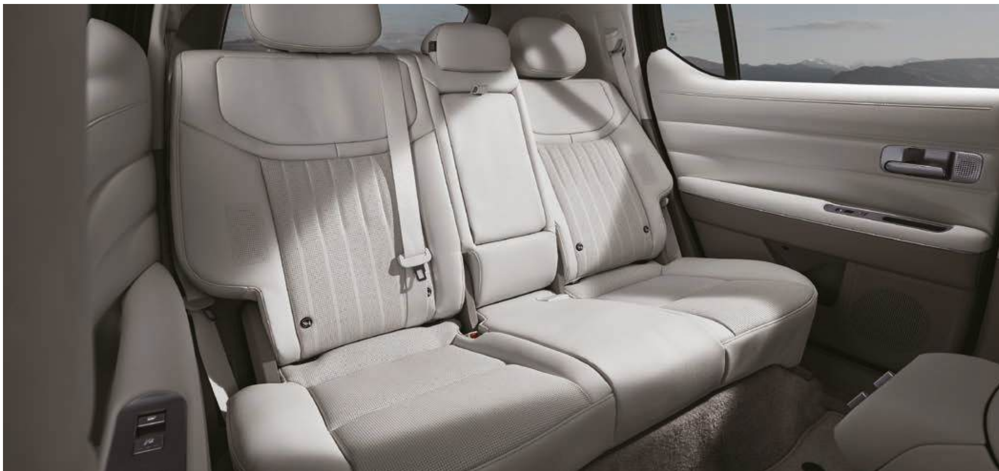
Asientos reclinables en la segunda fila (hasta 14°)