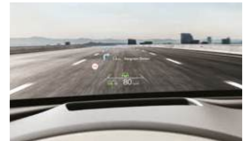
Head-up Display (HUD)