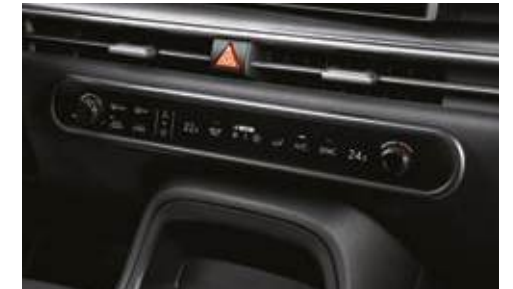
Climatizador delantero bizona