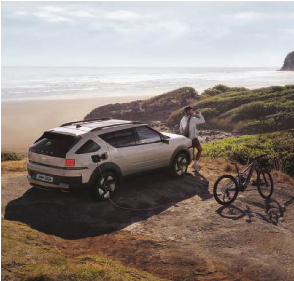
Carga exterior de V2L (no necesita adaptador)