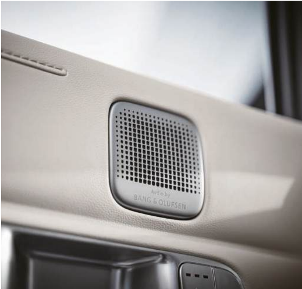
El NEXO viene con un sistema de sonido Premium Sound de Bang & Olufsen que incluye hasta 14 altavoces