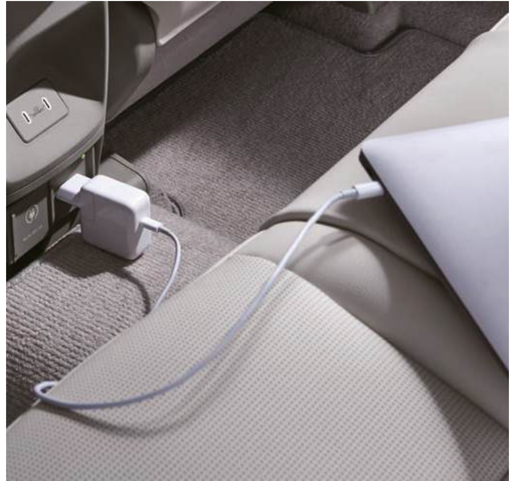
Carga interior de V2L