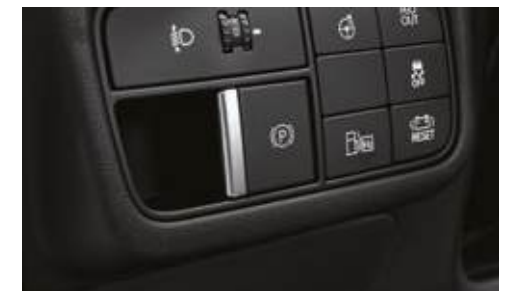
Freno de mano eléctrico

* Las especificaciones y características pueden variar dependiendo del mercado. Consulta con tu concesionario más cercano.