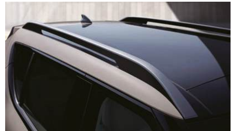
Manetas automáticas de apertura Portaequipajes de techo