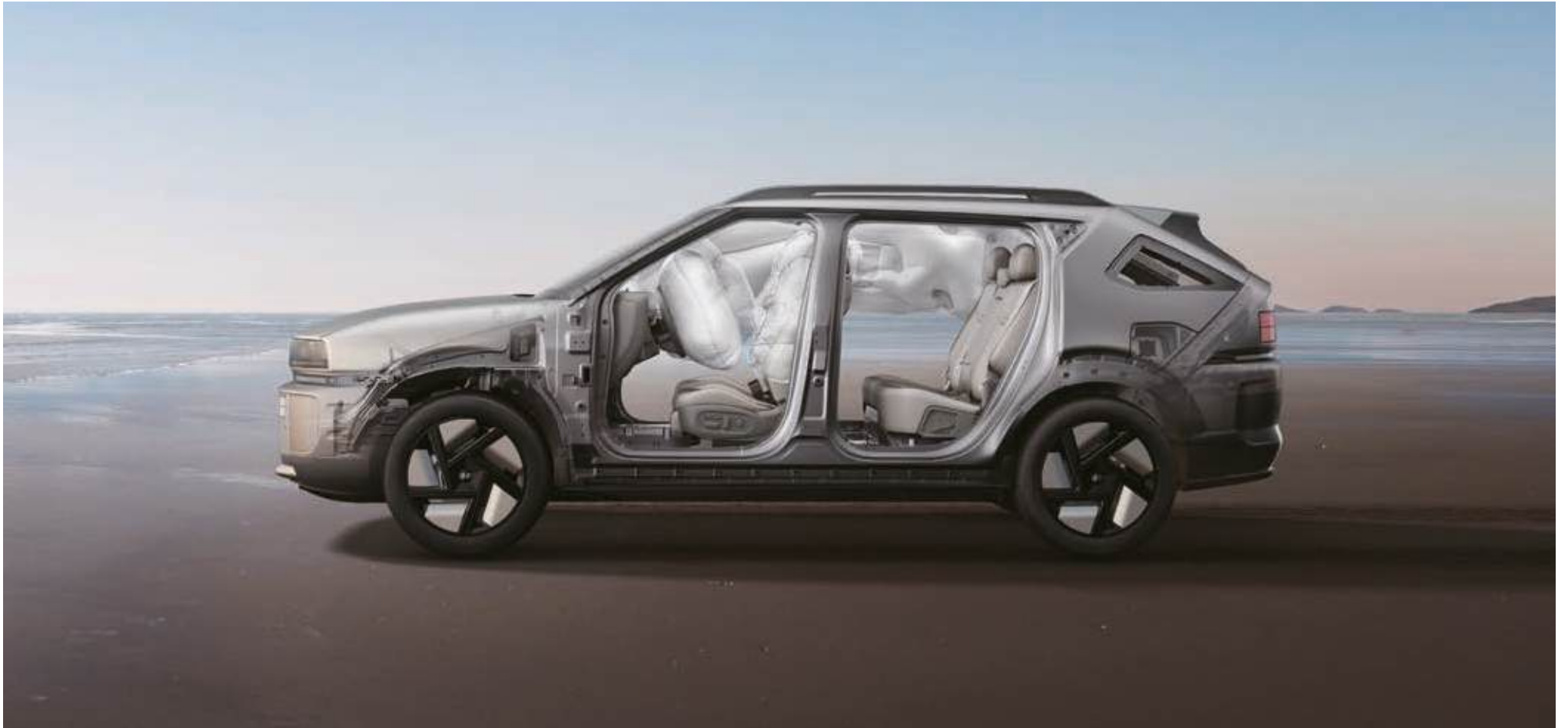
Refuerzo de la plataforma y sistema de 7 airbags

La carrocería se ha reforzado de forma significativa para ofrecerte la máxima protección y se han mejorado los sistemas de seguridad para los pasajeros.