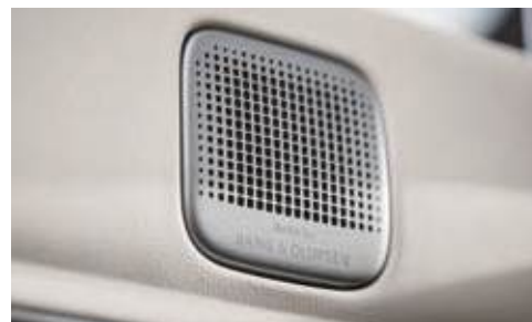
Sistema de sonido Premium Bang & Olufsen