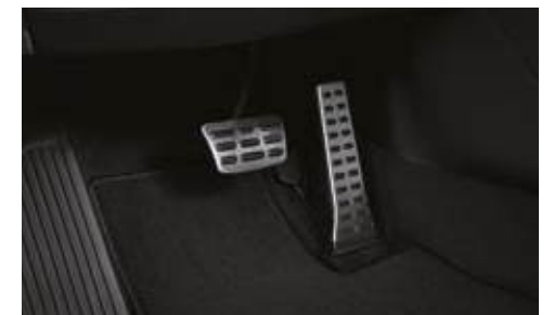
Pedales de metal

* Las especificaciones y características pueden variar dependiendo del mercado. Consulta con tu concesionario más cercano.