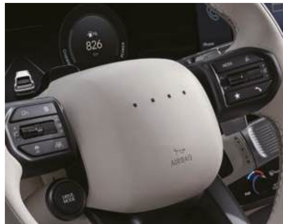
Cambio en selector giratorio detrás de volante (SBW) Volante con luces pixeladas interactivas