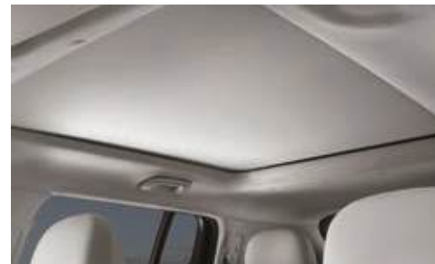
Cortinilla para techo solar