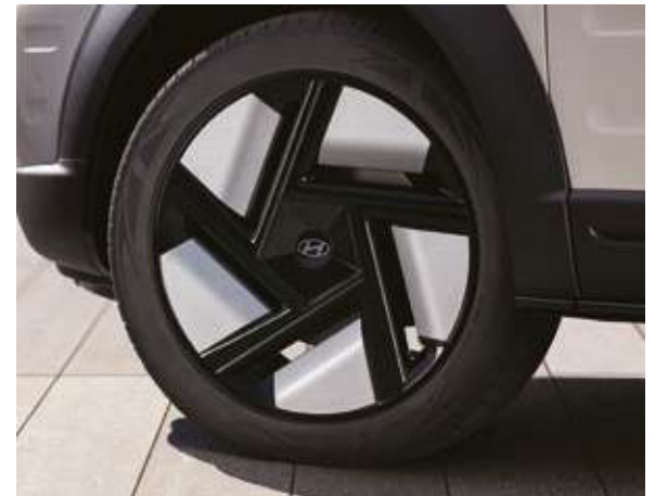
Adorno central, faros LED completos, luces LED diurnas Llantas de aleación de 19 pulgadas