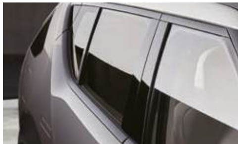
Vidrio laminado acústico (trasero y delantero)