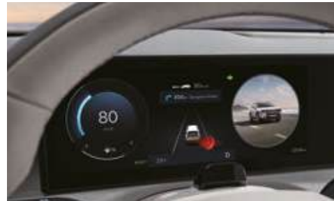
Monitor de ángulo muerto (BVM)