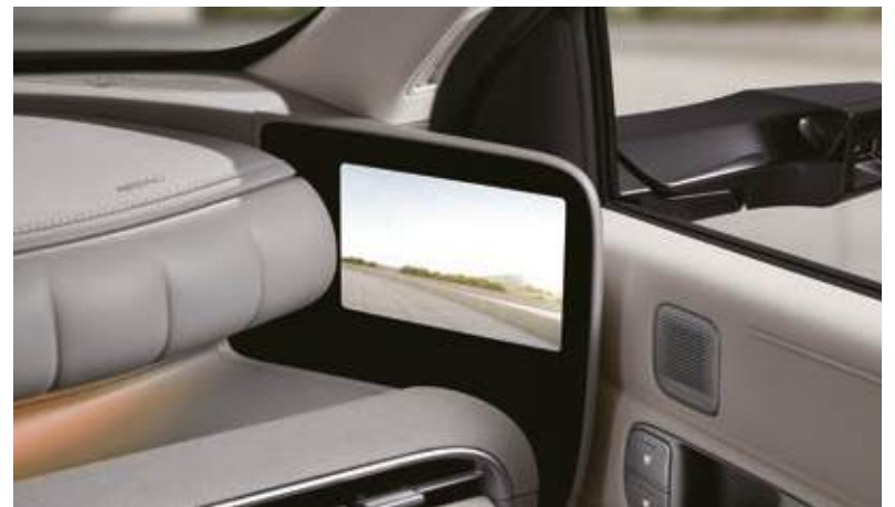
Retrovisor digital lateral (DSM)