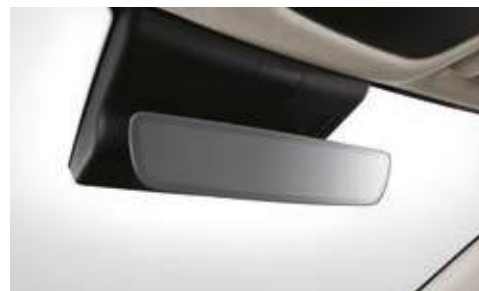
Espejo cromático eléctrico (ECM, espejo interior)