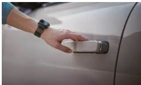
Llave digital 2.0