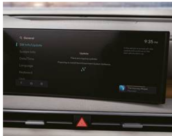
Sistema de memoria integrada (IMS) Actualización de software inalámbrica (Over-the-Air)