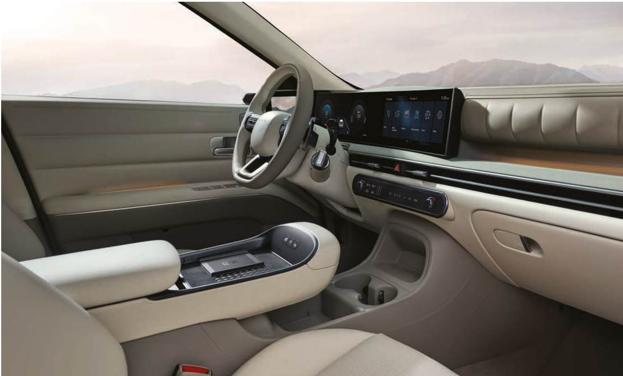
Amplio habitáculo interior, orientado al conductor y pasajero