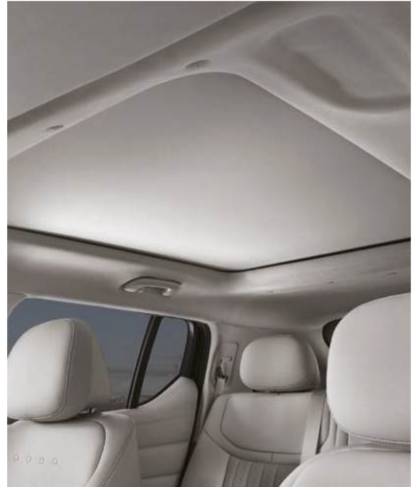
Cortinilla interior para techo solar