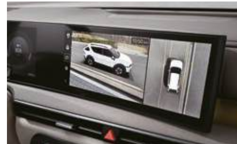
Monitor de visión 360°