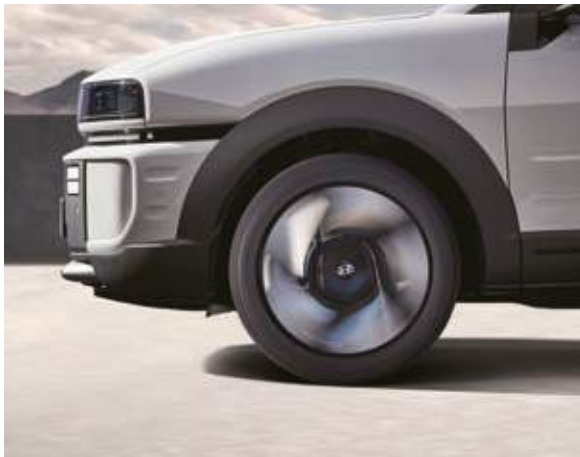
Sistema de sonido activo (E-ASD) Cancelación de ruido en carretera (ANC-R)