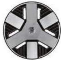
Llantas de aleación de 18 pulgadas