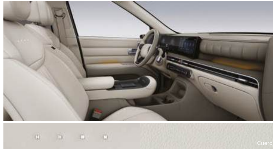
Serene Gray / Mosi Ivory

* Las especificaciones y características pueden variar dependiendo del mercado. Consulta con tu concesionario más cercano.