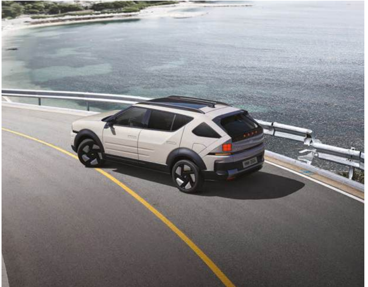
Sistema de frenado multicolidión en caso de accidente