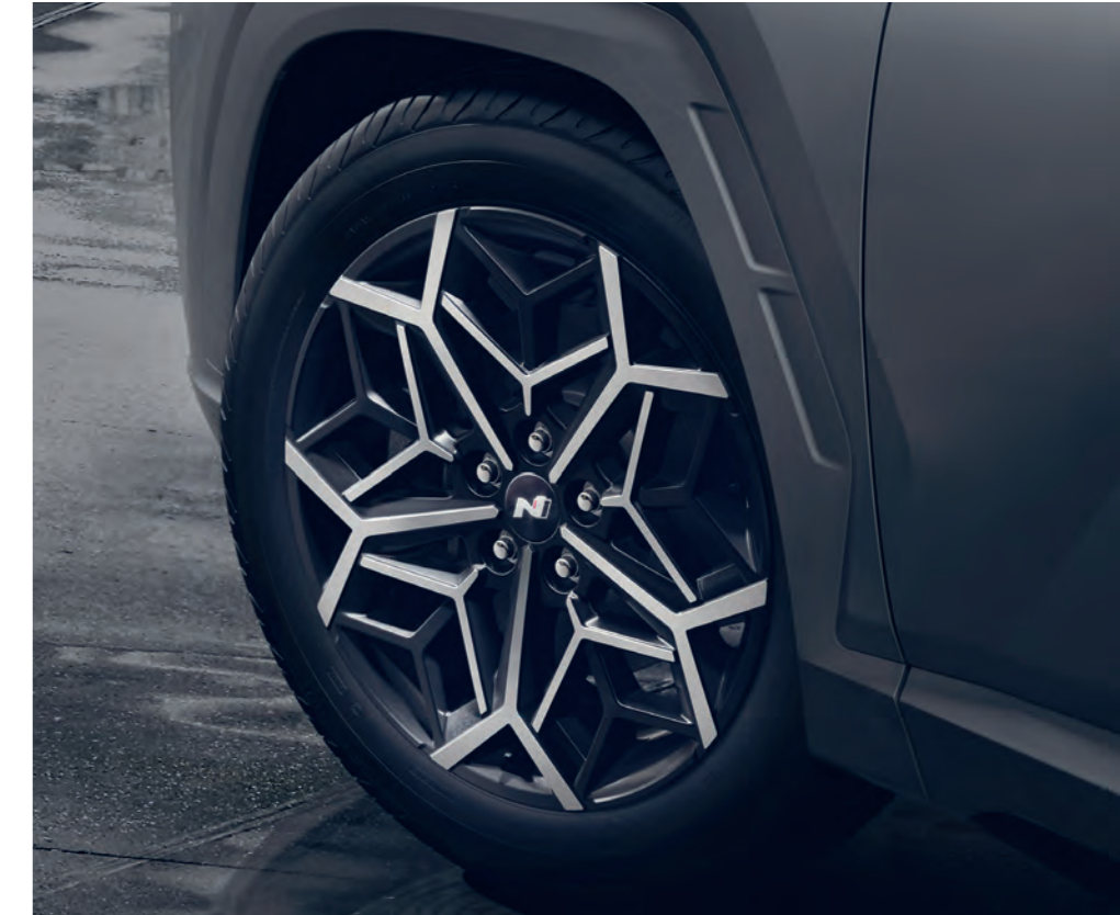
Energické a športové 19-palcové disky z ľahkej zliatiny pokračujú v téme zmyselnej športovosti parametrickým vzorom, zvýrazňujúcim ich geometrickú štruktúru.