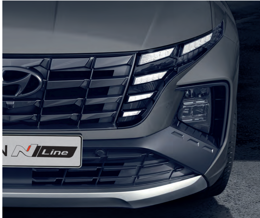
Širší, hranatý nárazník N Line so zväčšenými vstupnými otvormi vzduchu je nápadným prvkom prednej časti karosérie.

Dizajnéri zvýraznili stabilný, široký postoj modelu TUCSON N Line posunutím masky chladiča a dizajnových prvkov na nárazníkoch ďalej do bokov pre horizontálne orientovaný, atletický vzhľad. Širšia maska chladiča N Line s lichobežníkovým dizajnom nesie logo N Line, svetlomety majú čiernu obrubu.