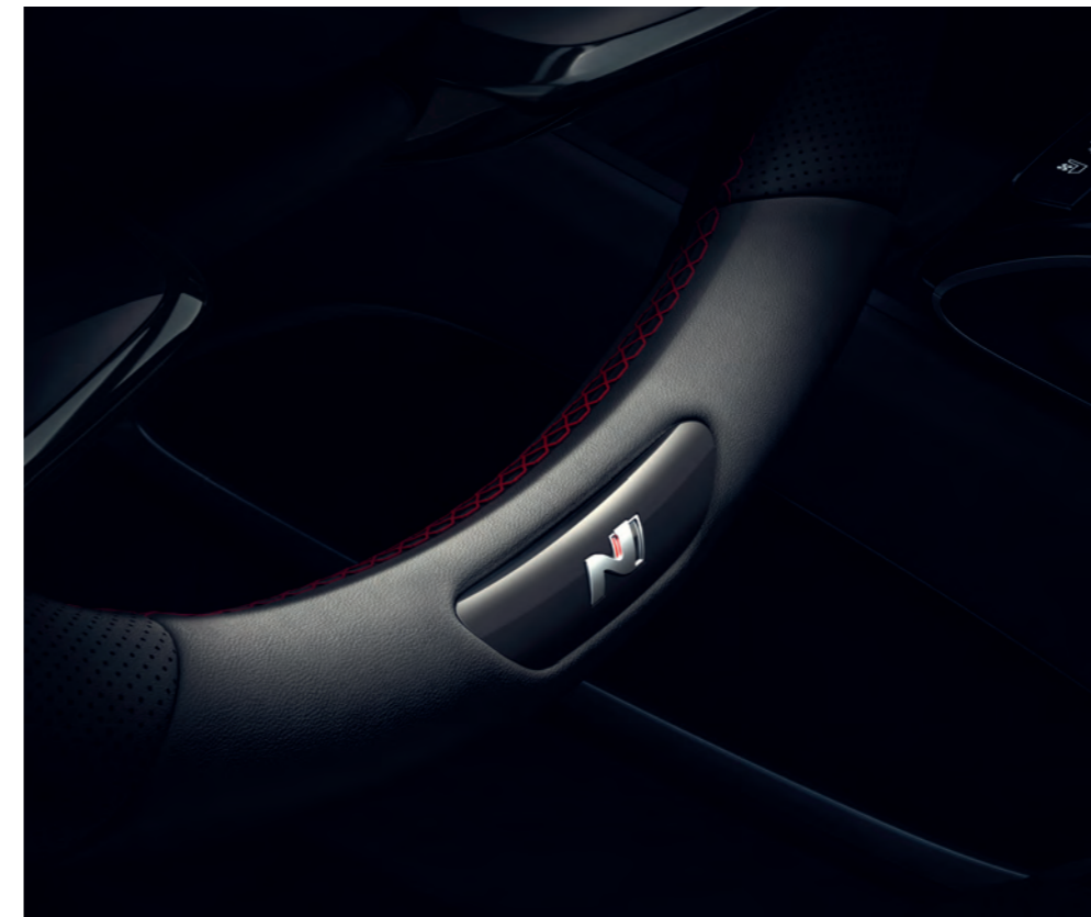
Športový volant N Line s metalickými ramenami, potiahnutý jemnou kožou s červeným kontrastným prešívaním, hrdo nesie logo N.

Vitajte na úplne novej úrovni precíznosti. Usadte sa do modifikovaného kokpitu úplne nového modelu TUCSON N Line a okamžite pocítite jeho elegantnú, profesionálnu atmosféru. Športové sedadlá N Line sú potiahnuté luxusnou kombináciou perforovaného umelého semišu a kože. Sú opatrené logom N a červeným kontrastným prešívaním, ktoré sa opakuje aj na obložení dverí a laktovej opierke. Ďalšie dizajnové prvky N možno nájsť na koženej hlavici radiacej páky alebo kryte konzoly s tlačidlami jazdného režimu shift-by-wire – podľa zvolenej prevodovky. Osobitý športový nádych dodáva interiéru čierny strop kabíny. Ďalšie špecifické prvky N predstavujú kovové pedále, opierka ľavej nohy a dekoratívne obklady na prahoch dverí.