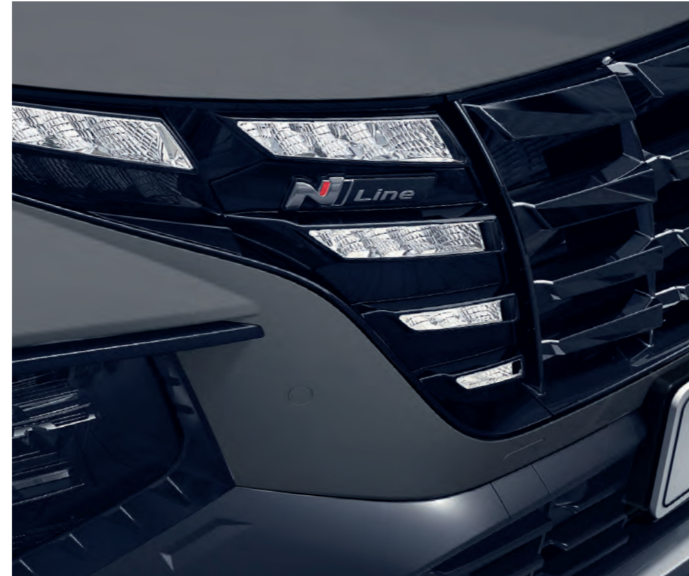
Parametrický vzor masky chladiča N Line bol doplnený dynamickým zakončením na bokoch, vytvárajúcim ďalšie reflexie.