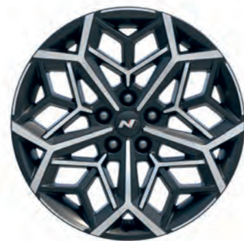
19" disky z ľahkej zliatiny

Úplne nový TUCSON N Line je vybavený špecifickými 19" diskami z ľahkej zliatiny. Pôsobia energicky a športovo, parametrický vzor zvýrazňuje ich geometrickú štruktúru v duchu témy zmyselnej športovosti.