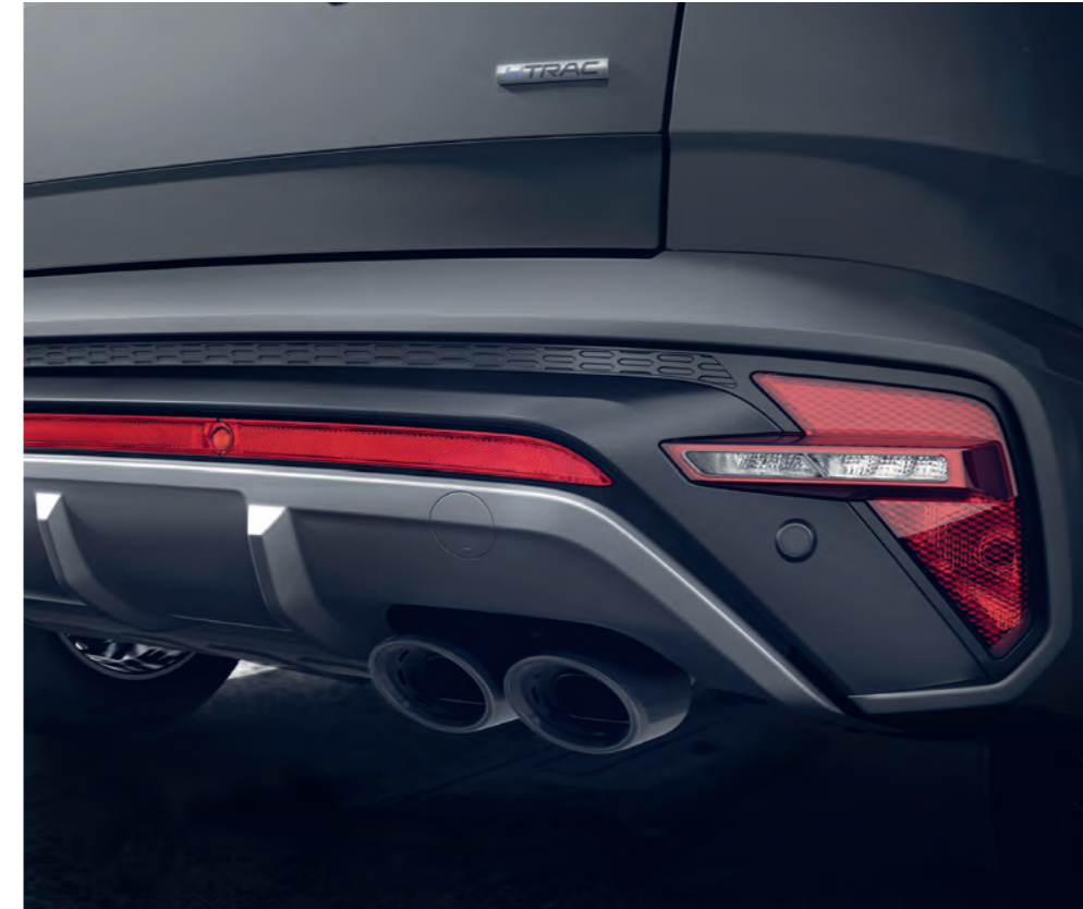
Zadný nárazník so športovou dvojitou koncovkou výfuku zospodu uzatvára strieborný nájazdový štít, akcentovaný červeným reflexným pásom.