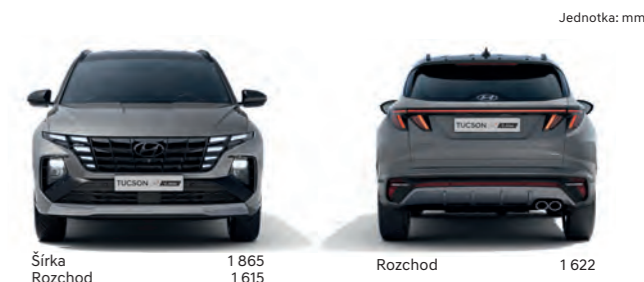
Šírka Rozchod 1 865 1 615 Rozchod 1 622

Spoločnosť HYUNDAI MOTOR CZECH s. r. o., organizačná zložka Slovakia, si vyhradzuje právo na zmeny údajov bez predchádzajúceho upozornenia a bez akýchkoľvek záväzkov, ktoré by mohli z takýchto zmien vzniknúť.