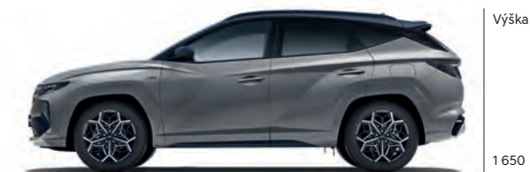
Dĺžka Rázvor 4 510 2 680 Výška 1 650