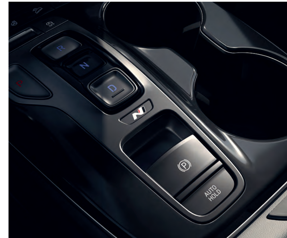
Logo N je aj na elegantnom kryte konzoly shift-by-wire na stredovej konzole.