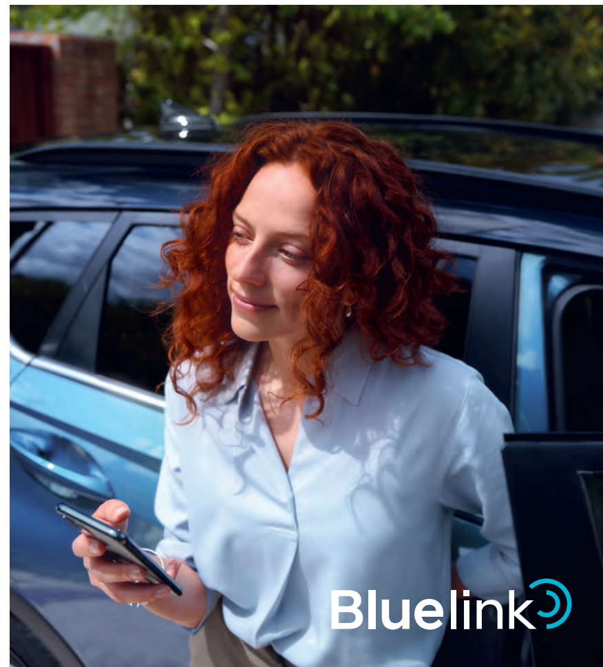
BAYON integruje online služby BlueLink Connected Car Services poskytujúce konektivitu prostredníctvom aplikácie pre smartfóny alebo centrálného dotykového displeja infotainmentu s uhlopriečkou 26 cm (10,25").