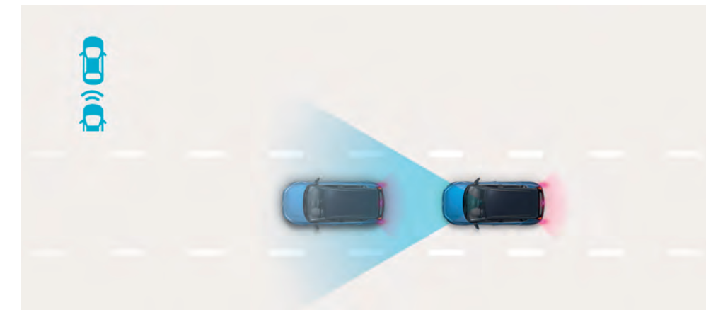
Systém autonómneho núdzového brzdzenia (FCA) automaticky zabrzdí vozidlo, keď hrozí riziko kolízie s vozidlom idúcim vpredu alebo cyklistami a chodcami v jazdnej dráhe. ◊