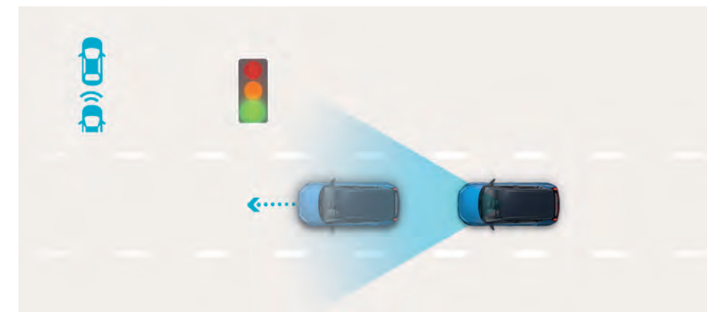
Upozornenie na odjazd vpredu stojaceho vozidla (LVDA) upozorní vodiča, keď sa vozidlo stojace vpredu rozbehne, napríklad na semafore alebo v dopravnej zápche. ◊