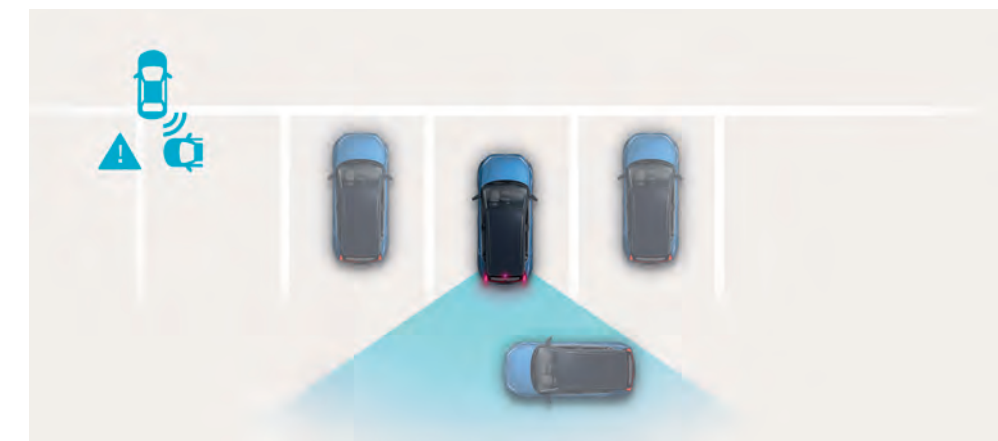
Asistent na upozornenie na vozidlá približujúce sa v priečnom smere pri cúvaní (RCCA) upozorňuje na vozidlá približujúce sa z boku, ale – ak je to potrebné – aj automaticky zabrzdí. ◊