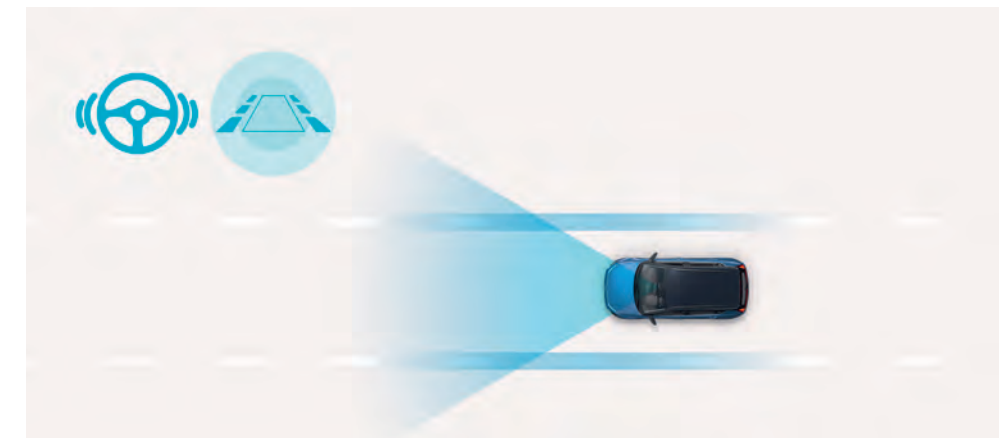
Asistent udržiavania jazdného pruhu (LFA) jemnou korekciou riadením automaticky udržiava vozidlo v strede jazdného pruhu v rozsahu rýchlosti od 0 do 180 km/h na diaľniciach a mestských uliciach. ◊

So svojimi vyspelými asistenčnými systémami a kompletom aktívnej bezpečnosti s celým radom inovatívnych funkcií vám BAYON poskytuje ešte väčšiu bezstarosť.