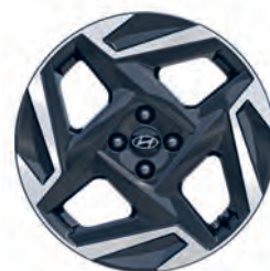
17" disky z ľahkej zliatiny