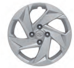
15" kryty kolies