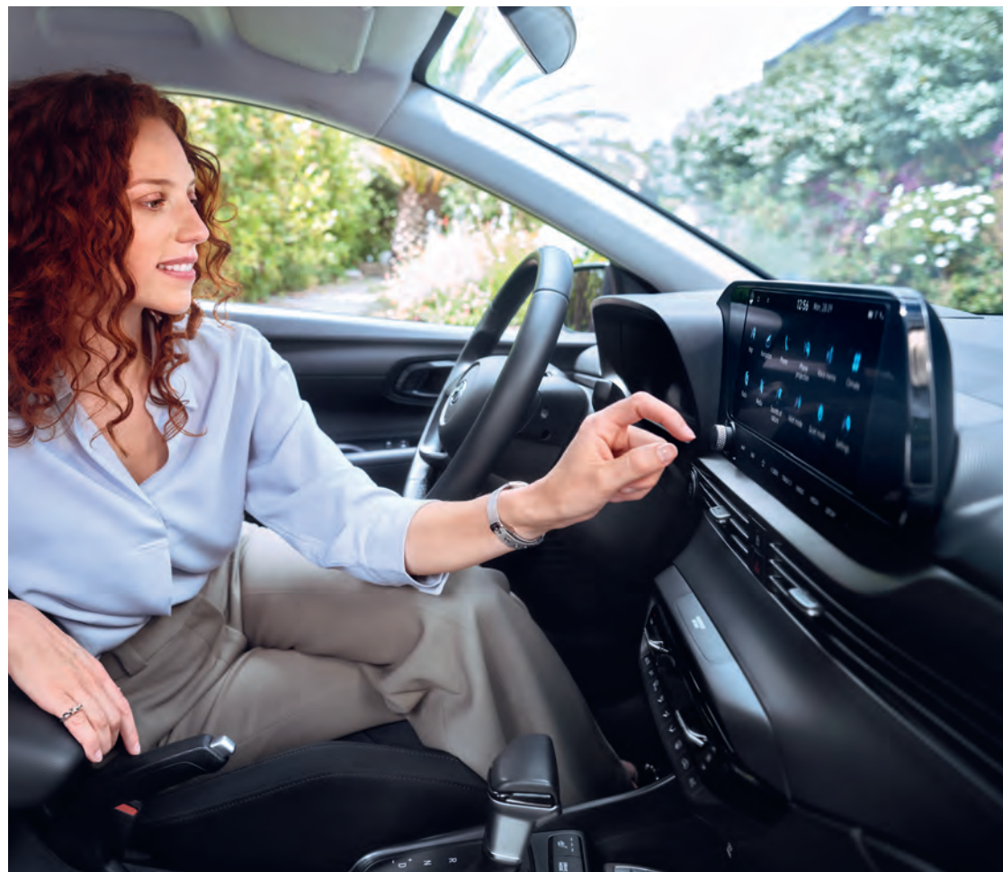
Apple CarPlay™ a Android Auto™ vám umožňujú zrkadliť si vaše aplikácie, hudbu a layout telefónu na veľkej obrazovke.*

Vychutnajte si najmodernejšie inteligentné technológie s dvoma veľkými displejmi s funkciou rozdelenej obrazovky. Pokročilý digitálny kokpit a špičkové funkcie infotainmentu modelu Hyundai BAYON zlepšili online aktualizácie máp Over The Air (OTA).