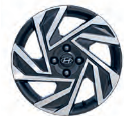
16" disky z ľahkej zliatiny