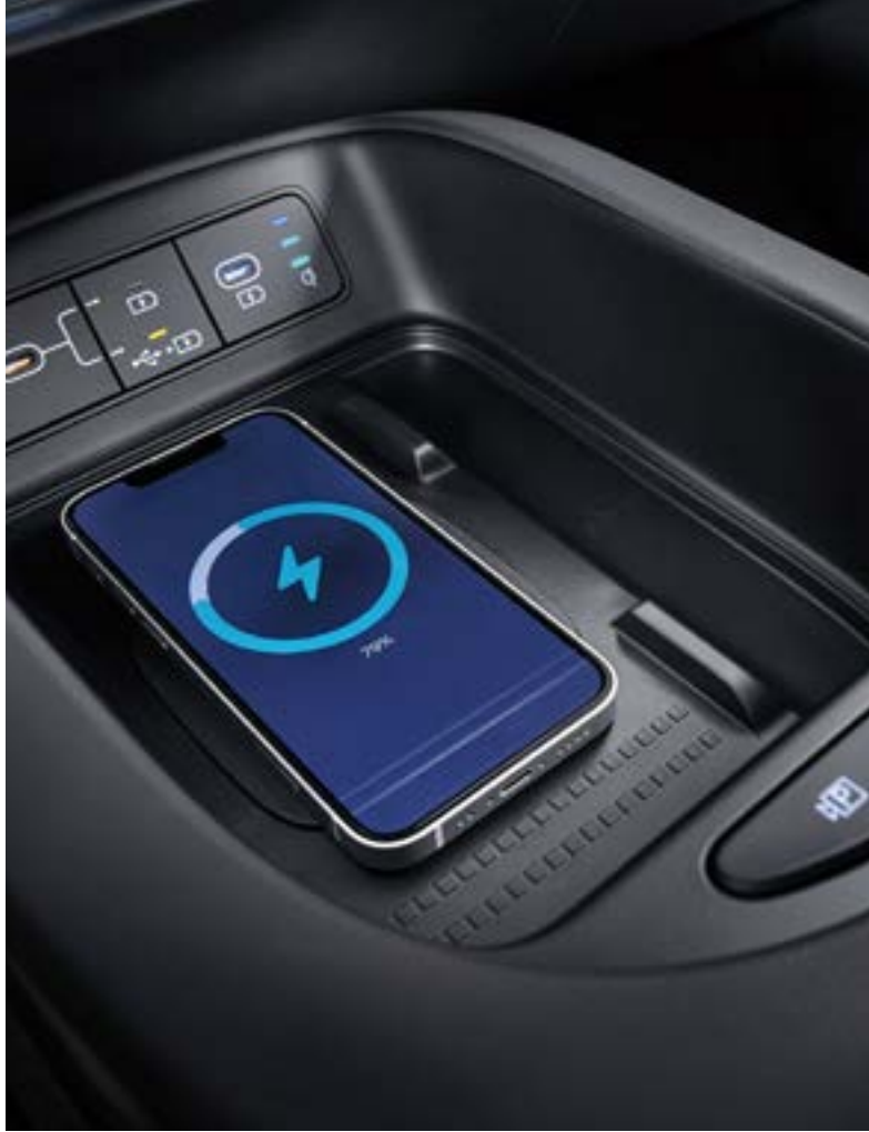
Yüksek hızlı kablosuz şarj pedi