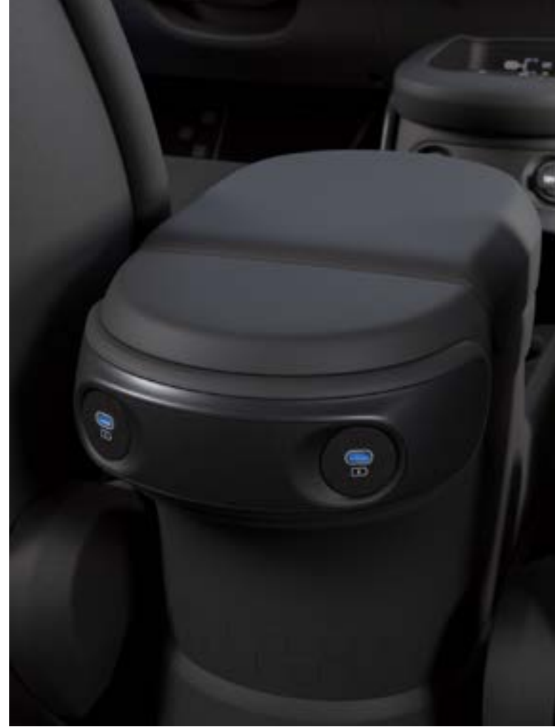
Ön ve arkada Type-C USB girişi