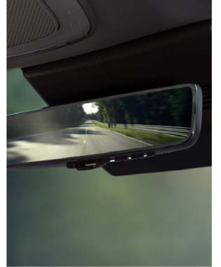
Dijital kameralı dikiz aynası