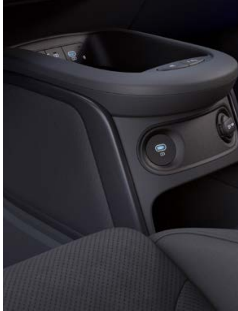
Pist için optimize edilen orta konsol