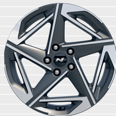
N Line 225/40 ZR18