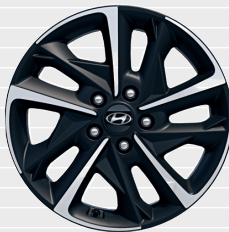
Vertex® 225/45 R17