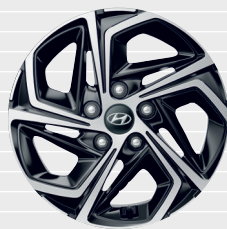
Amplia® 205/55 R16