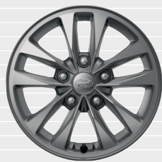
Origo® 195/65 R15