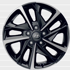
Vertex® 225/45 R17