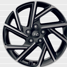
N Line 225/40 ZR18