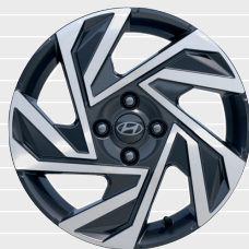
Amplia® 16" Leichtmetallfelgen 195/55 R16