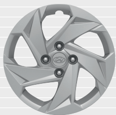
Pica® / Origo® 15" Stahlfelgen mit Radzierblenden 185/65 R15