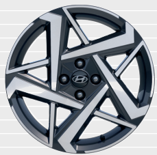
Vertex® 17" Leichtmetallfelgen 215/45 R17