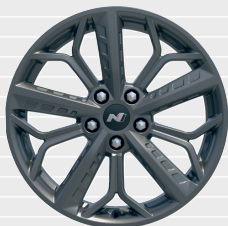
Leichtmetallfelgen 18" 215/40 R18