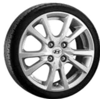
1. HMD02 Silber 6,0×15" ET47 4×100 999XF02010108