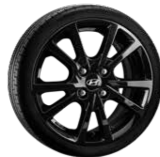
2. HMD02 Schwarz 6,0×15" ET47 4×100 999XF02010109