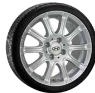
2. Octopus X Silber 7,0J×17" ET49 9999Z010846F