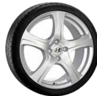
2. Narvi Silber 6,5×16" ET48 999XF0203068