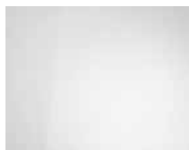
Atlas White (Uni) 1