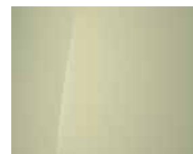
Buttercream Yellow (Mineraleffekt) 1