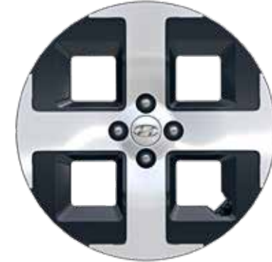
6,5 J x 17-Zoll-Leichtmetallfelgen mit 205/45 R 17 Bereifung 2