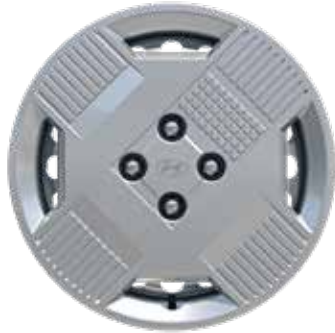
5,5 J x 15-Zoll-Stahlfelgen mit Radzierblende und 185/65 R 15 Bereifung

Jetzt Ihren Hyundai INSTER konfigurieren.