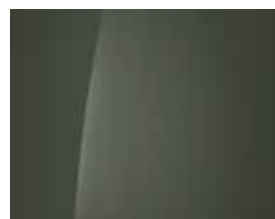
Tomboy Khaki (Uni) 1