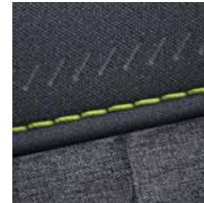
Sitzpolsterung in Stoff Dunkelgrau mit limonengelben Applikationen 3