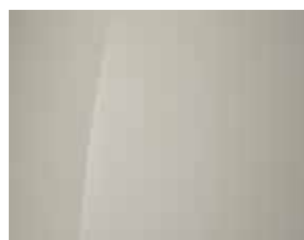
Unbleached Ivory (Uni)

Jetzt Ihren Hyundai INSTER konfigurieren.