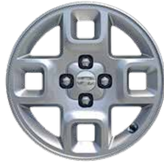
5,5 J x 15-Zoll-Leichtmetallfelgen mit 185/65 R 15 Bereifung