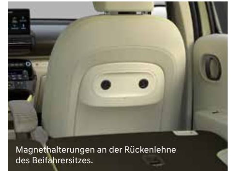
Magnethalterungen an der Rückenlehne des Beifahrersitzes.