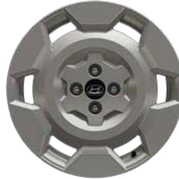
6,5 J x 17-Zoll-Leichtmetallfelgen mit 205/45 R 17 Bereifung 1