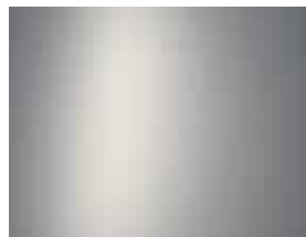
Aero Silver (Matt) 1