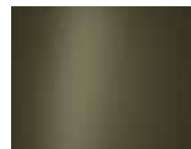
Amazonas Green (Matt) 1