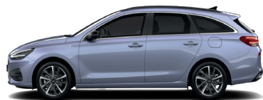
Meta Blue – Perleťová 690 €