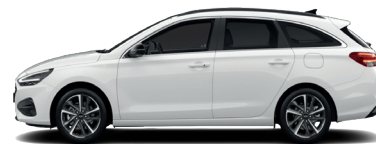
Atlas White – Pastelová 300 €