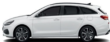
Serenity White – Perleťová 690 €