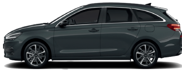
Cypress Green – Perleťová 690 €