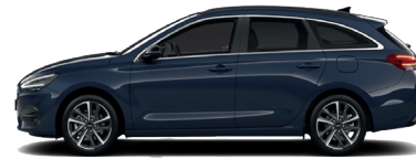
Sailing Blue – Perleťová 690 €