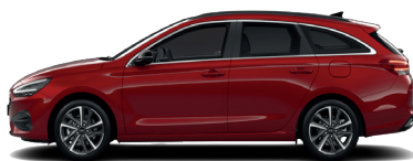
Ultimate Red – Metalická 690 €