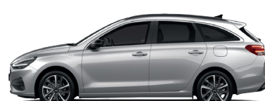
Shimmering Silver – Metalická 690 €