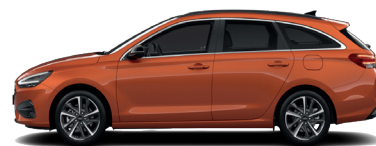
Jupiter Orange – Metalická 690 €