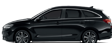
Abyss Black – Perleťová 690 €