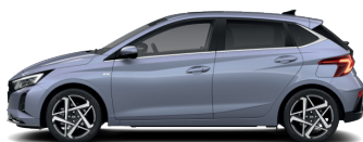
Meta Blue – Perleťová 4,5 590 €