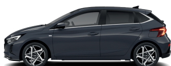
Aurora Gray – Perleťová 590 €