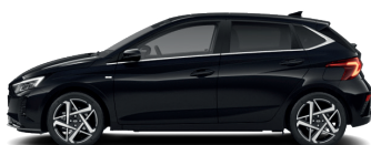
Phantom Black – Perleťová 590 €