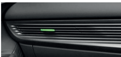
Čierny so zelenými akcentmi