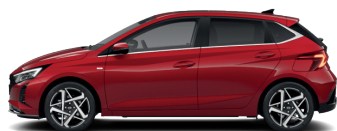
Dragon Red – Perleťová* 590 €