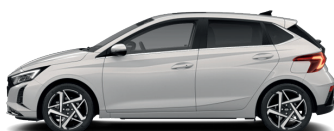
Lumen Gray – Perleťová* 590 €