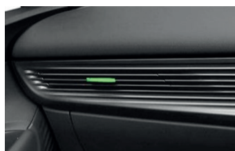
Čierny so zelenými akcentami