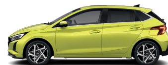
Lucid Lime – Metalická* 590 €