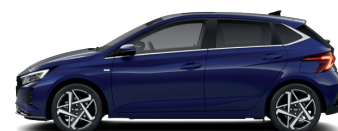
Vibrant Blue – Perleťová* 590 €