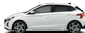
Atlas White – Pastelová* 590 €