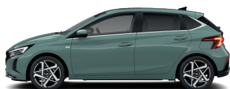
Mangrove Green – Perleťová* 0 €

* Dostupné v kombinácii so strechou lakovanou v čiernej farbe.