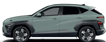
Mirage Green – Pastelová* 0 €

* Dostupné v kombinácii so strechou lakovanou v čiernej farbe.