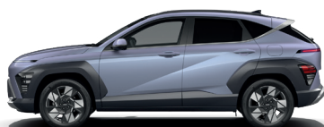
Meta Blue – Perleťová* 690 €