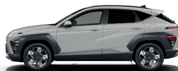
Cyber Gray – Metalická* 690 €