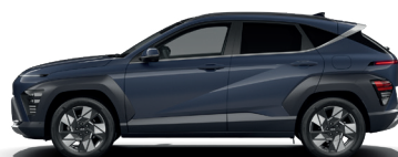
Denim Blue – Perleťová* 690 €