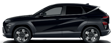
Abyss Black – Perleťová 690 €