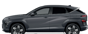
Ecotronic Gray – Perleťová* 690 €