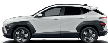
Atlas White – Pastelová* 300 €