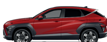
Ultimate Red – Metalická* 690 €