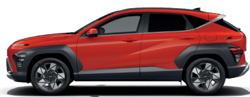
Soultronic Orange – Perleťová* 690 €