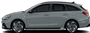
Shadow Gray – Pastelová 5 300 €