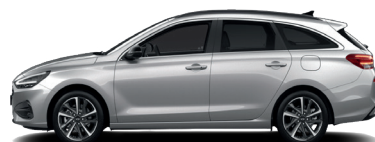
Shimmering Silver – Metalická 690 €