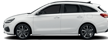
Atlas White – Pastelová 300 €