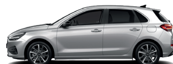
Shimmering Silver – Metalická 690 €