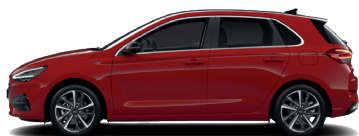
Engine Red – Pastelová 0 €