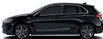
Abyss Black – Perleťová 690 €