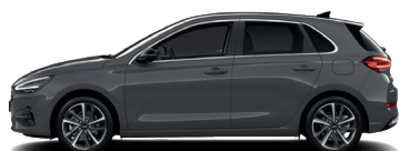
Ecotronic Gray – Perleťová 690 €