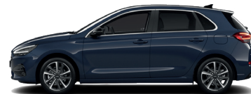
Sailing Blue – Perleťová 690 €