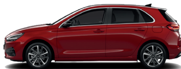
Ultimate Red – Metalická 690 €