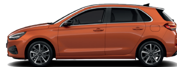
Jupiter Orange – Metalická 690 €