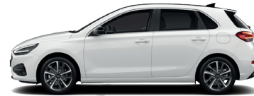
Atlas White – Pastelová 300 €