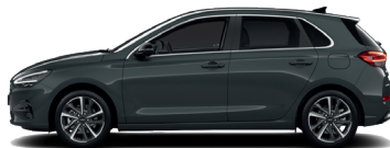
Cypress Green – Perleťová 690 €