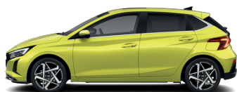
Lucid Lime – Metalická 3 0 €