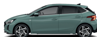
Mangrove Green – Perleťová 3 590 €