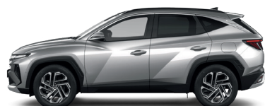
Shimmering Silver – Metalická 3 760 €