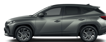
Pine Green – Matná 3,4 1 090 €