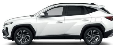
Atlas White – Pastelová 300 €