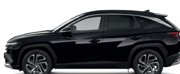
Abyss Black – Perleťová 760 €