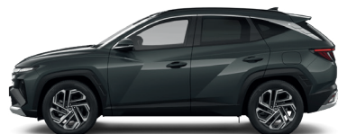
Cypress Green – Perleťová 3 760 €