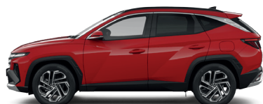
Engine Red – Pastelová 3 0 €