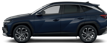
Sailing Blue – Perleťová 3 760 €