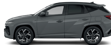
Shadow Gray – Pastelová 3 300 €