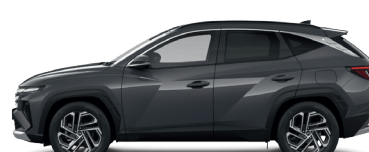
Ecotronic Gray – Perleťová 3 760 €