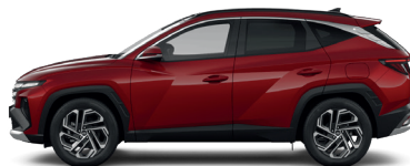
Ultimate Red – Metalická 3 760 €