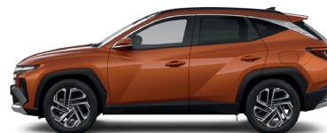
Jupiter Orange – Metalická 3 760 €