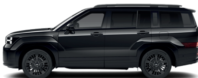
Abyss Black – Perleťová 860 €