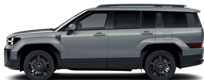
Pebble Blue – Perleťová 860 €