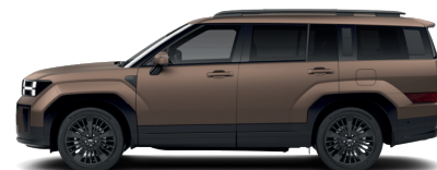
Earthy Brass – Matná 1 190 €