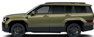
Ocado Green – Perleťová 860 €