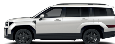
Creamy White – Perleťová 860 €