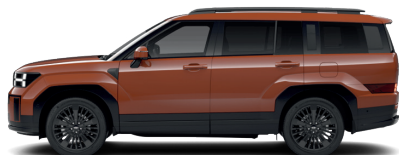
Terracota Orange – Pastelová 0 €