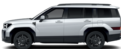
Typhon Silver – Metalická 760 €