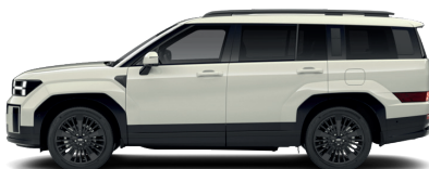
Cyber Sage – Perleťová 860 €