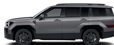
Ecotronic Gray – Metalická 760 €