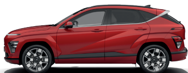
Ultimate Red – Metalická* 690 €