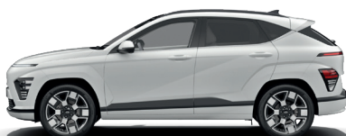
Atlas White – Pastelová* 300 €