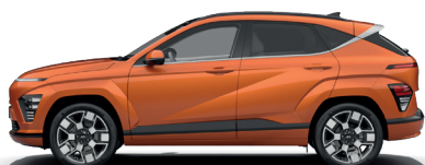
Jupiter Orange – Metalická* 690 €