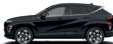
Abyss Black – Perleťová 690 €