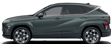
Cypress Green – Perleťová* 690 €