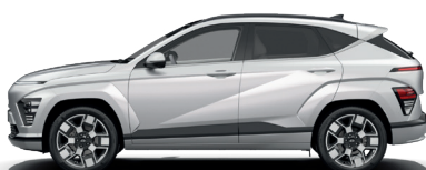
Shimmering Silver – Metalická* 690 €