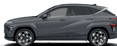
Ecotronic Gray – Perleťová* 690 €