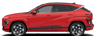
Engine Red – Pastelová* 0 €

* Dostupné v kombinácii so strechou lakovanou v čiernej farbe.