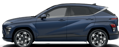
Sailing Blue – Perleťová* 690 €