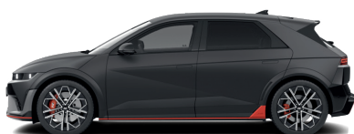
Ecotronic Gray – Matná 1 090 €