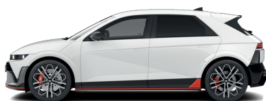
Atlas White – Pastelová 760 €