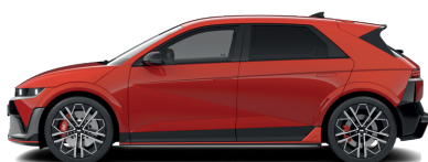
Soultronic Orange – Perleťová 0 €