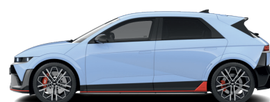
Performance Blue – Pastelová 760 €