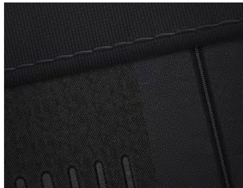
Asientos en negro/gris