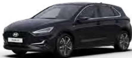
Abyss Black Mica + € 895