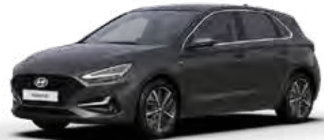
Dark Knight Mica + € 895