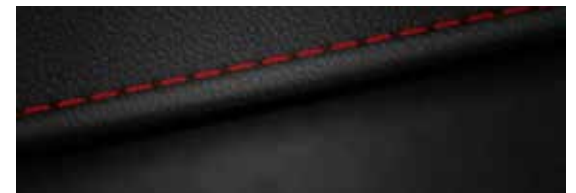
Suède/lederlook, zwart (N Line)w