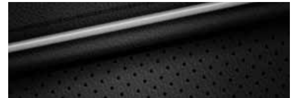
Lederlook, zwart (Premium)