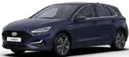
Teal Blue Mica + € 895