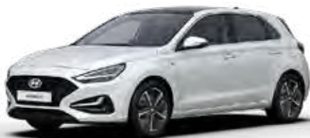
Atlas White Solid