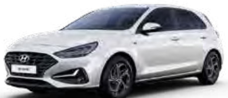
Serenity White Mica + € 895