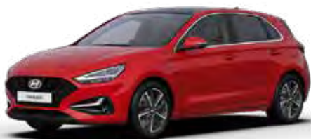
Engine Red Solid