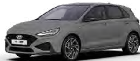
Shadow Grey Solid