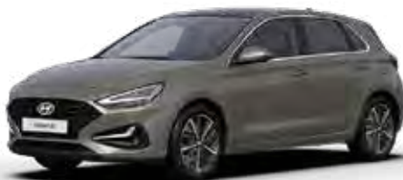
Silky Bronze Metallic + € 895