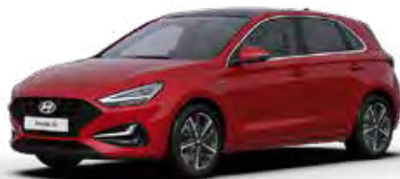
Sunset Red Mica + € 895