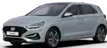
Shimmering Silver Metallic + € 895