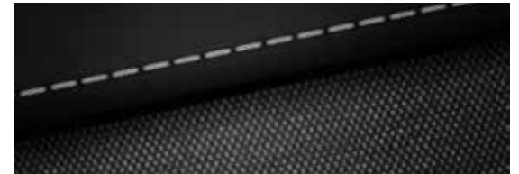
Stof, zwart (Comfort, Comfort Smart)