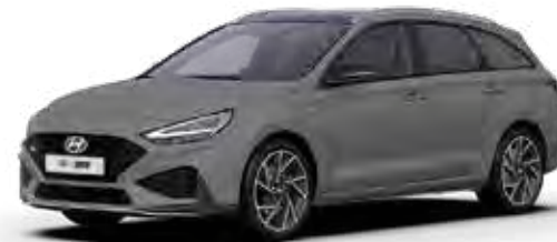
Shadow Grey Solid