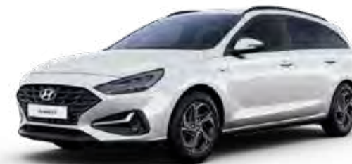
Serenity White Mica + € 895