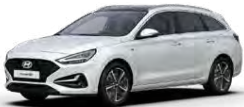
Atlas White Solid