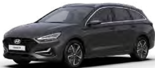
Abyss Black Mica + € 895