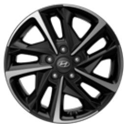
17-inch lichtmetalen velg