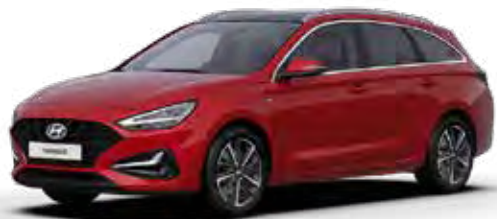
Sunset Red Mica + € 895

Kleuren kunnen onder invloed van het drukprocedé afwijken van de werkelijkheid. Sommige uitvoeringen zijn niet in alle hierboven genoemde kleuren leverbaar of alleen op speciale bestelling. Raadpleeg voor alle zekerheid je Hyundai-dealer. Vermelde prijzen zijn de consumentenprijzen incl. BTW.