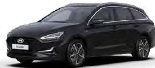
Dark Knight Mica + € 895