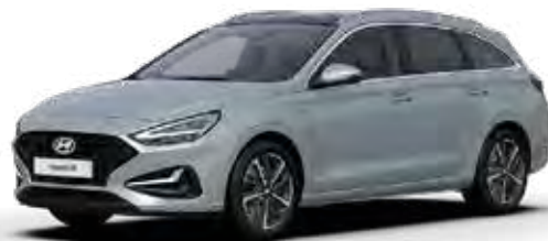
Shimmering Silver Metallic + € 895