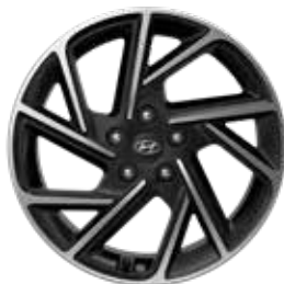
18-inch lichtmetalen velg 'N Line'