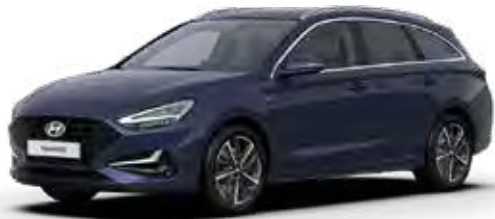
Teal Blue Mica + € 895