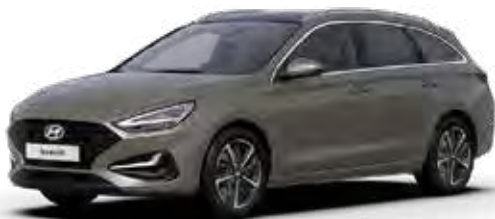
Silky Bronze Metallic + € 895