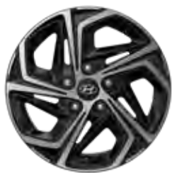
16-inch lichtmetalen velg