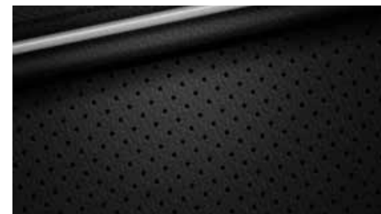
Lederlook, zwart (Premium)