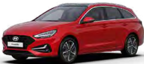
Engine Red Solid