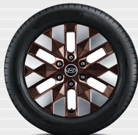
Vertex® Tinted Brass 235/55 R18