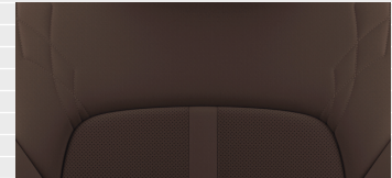
Nappa Leder braun