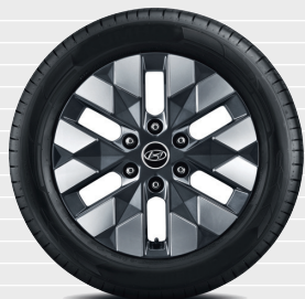
Amplia / Vertex® 235/55 R18