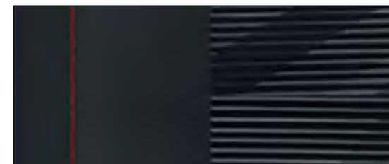
Stof, N Line