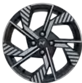
16-inch lichtmetalen velg 'N Line'