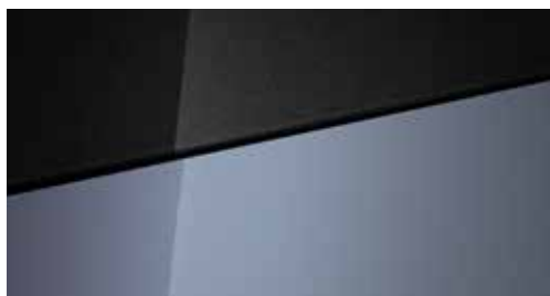
Meta Blue Mica + € 695 Meta Blue Mica Two-tone Phantom Black + € 995