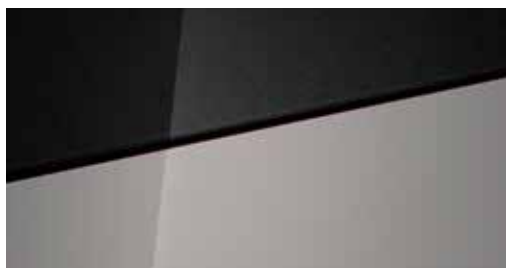
Lumen Gray Mica + € 695 Lumen Gray Mica Two-tone Phantom Black + € 995