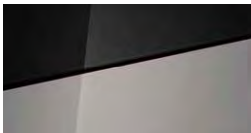
Lumen Gray Mica + € 695 Lumen Gray Mica Two-tone Phantom Black + € 995