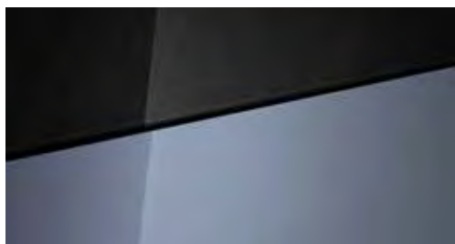
Meta Blue Mica + € 695 Meta Blue Mica Two-tone Phantom Black + € 995