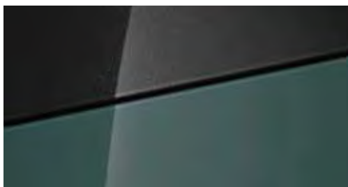
Mangrove Green Mica + € 695 Mangrove Green Mica Two-tone Phantom Black + € 995