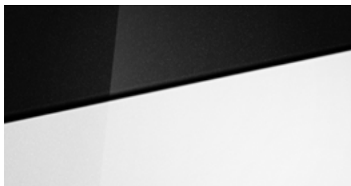
Atlas White Solid Atlas White Solid Two-tone Phantom Black + € 300