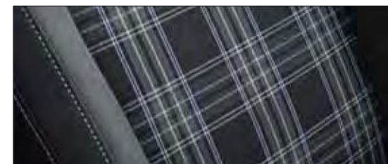
Stof, Purple Grey (Premium)