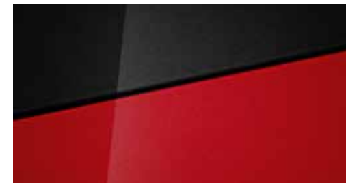
Dragon Red Mica + € 695 Dragon Red Mica Two-tone Phantom Black + € 995