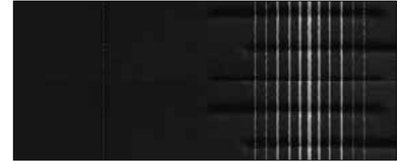
Stof, Obsidian Black met witte strepen (i-Drive, Comfort)