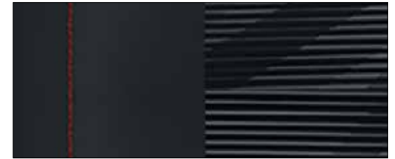
Stof, N Line