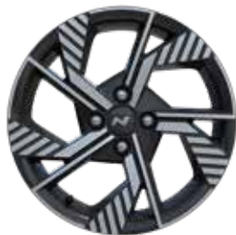
16-inch lichtmetalen velg 'N Line'