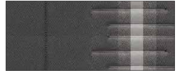
Stof, Shale Grey (Premium)