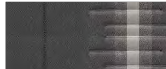
Stof, Shale Grey (Premium)