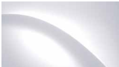
Creamy White Solid