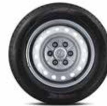
17-inch stalen velg