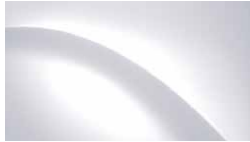
Creamy White Solid