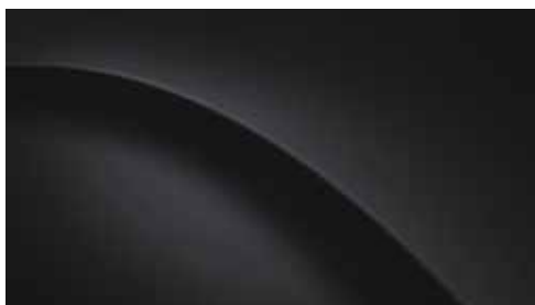
Abyss Black Pearl + € 550*