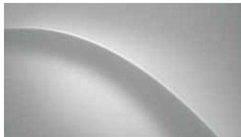
Shimmering Silver Metallic + € 665,50