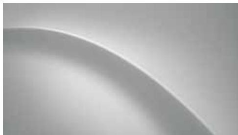
Shimmering Silver Metallic + € 665,50