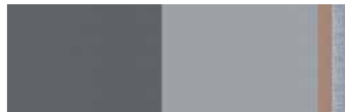
Shale Gray (standaard)