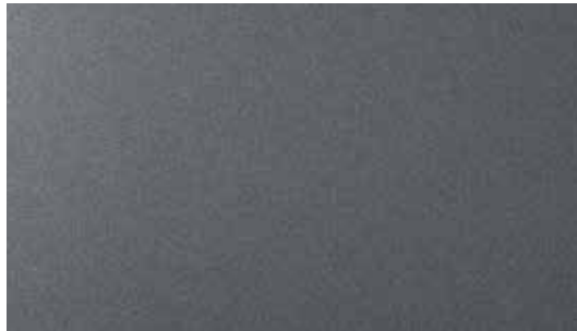
Titanium Grey Mat + € 1.895