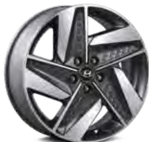
19-inch lichtmetalen velgen (alleen NEXO Plus)