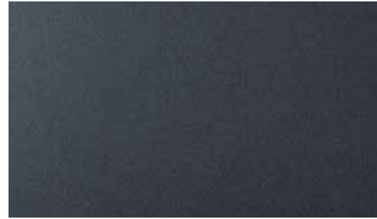
Dusk Blue Mica + € 1.000