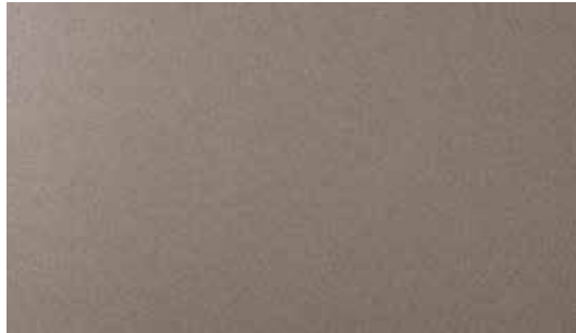
Copper Metallic + € 1.000