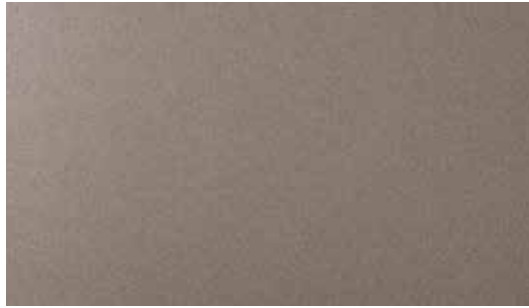
Copper Metallic + € 1.000