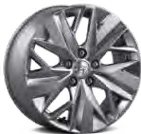
17-inch lichtmetalen velgen