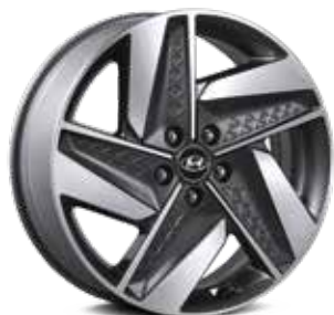
19-inch lichtmetalen velgen (alleen NEXO Plus)