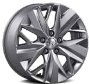
17-inch lichtmetalen velgen