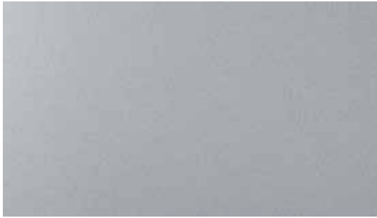
Cocoon Silver Metallic + € 1.000