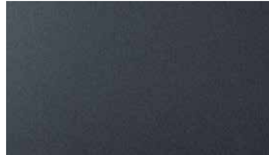
Dusk Blue Mica + € 1.000