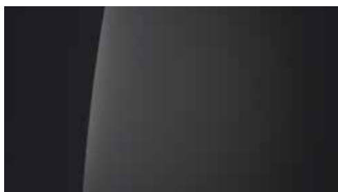
Biophilic Blue Pearl Mica + € 895