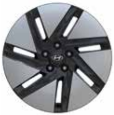
18-inch lichtmetalen velg