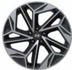
20-inch lichtmetalen velg