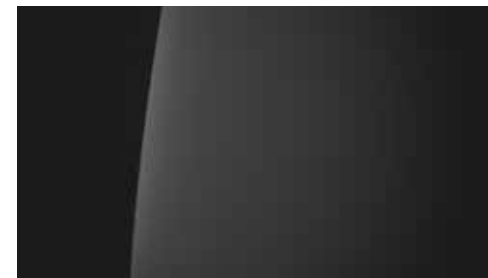
Abyss Black Pearl Mica + € 895