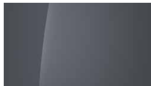
Transmission Blue Pearl Mica + € 895