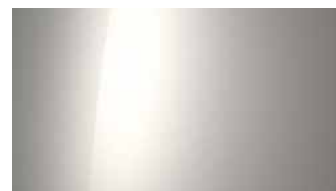
Gravity Gold Matte + € 1.095