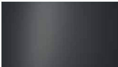
Nocturne Grey Matte + € 1.095