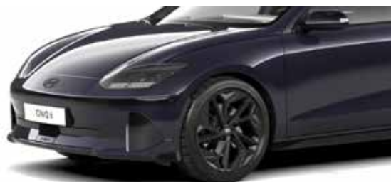
Biophilic Blue Pearl Mica