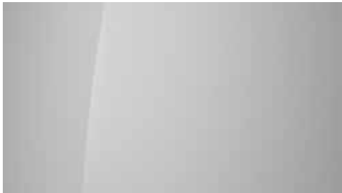
Serenity White Pearl Mica