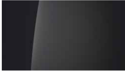
Biophilic Blue Pearl Mica