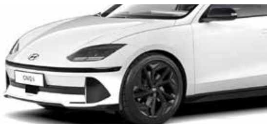
Serenity White Pearl Mica