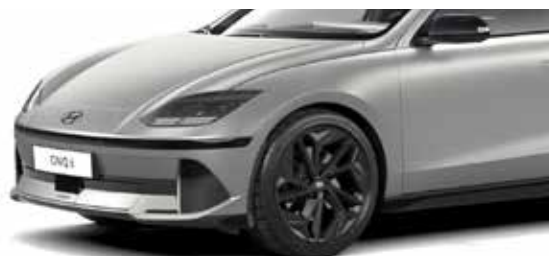
Gravity Gold Matte + € 200