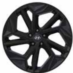
20-inch lichtmetalen velg