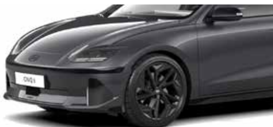
Nocturne Gray Metallic