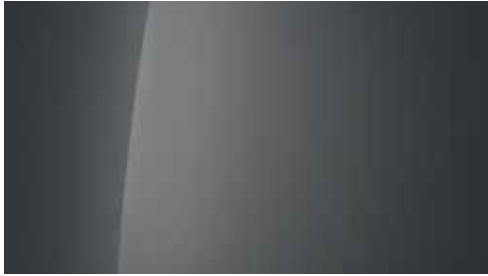
Nocturne Grey Metallic