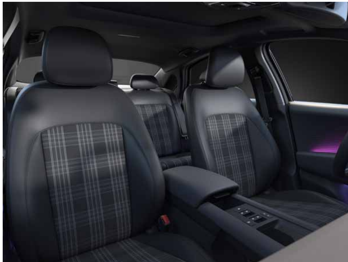
Stof/leder 'First Edition'