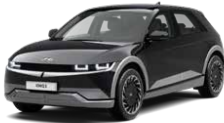
Abyss Black Pearl Mica + € 895