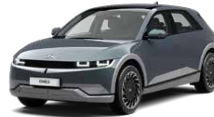
Digital Teal-Green Pearl Mica + € 895