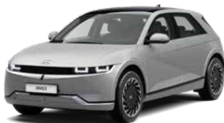
Gravity Gold Matte + € 1.095