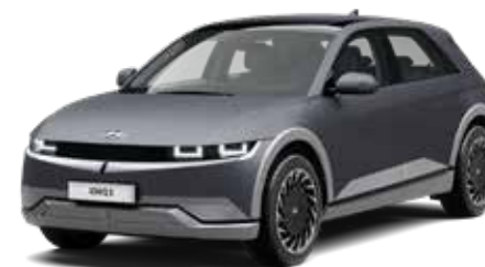
Shooting Star Gray Matte + € 1.095

Kleuren kunnen onder invloed van het drukprocedé afwijken van de werkelijkheid. Sommige uitvoeringen zijn niet in alle hierboven genoemde kleuren leverbaar of alleen op speciale bestelling. Raadpleeg voor alle zekerheid je Hyundai-dealer. Vermelde prijzen zijn de consumentenprijzen incl. BTW.