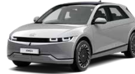
Cyber Gray Metallic + € 895