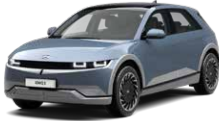
Lucid Blue Pearl Mica