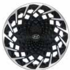
20-inch lichtmetalen velg