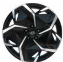
19-inch lichtmetalen velg