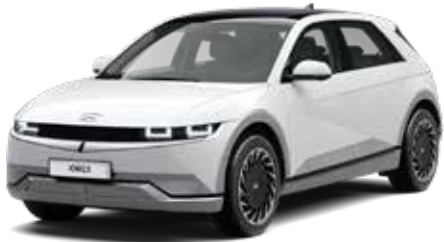
Atlas White Solid + € 695