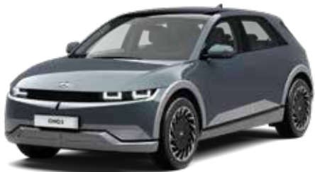
Ecotronic Gray Pearl Mica + € 895