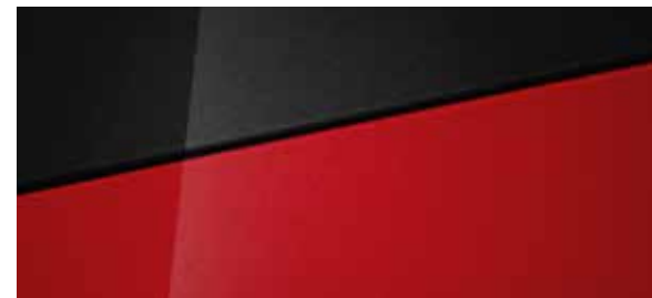
Dragon Red Mica + € 795 Dragon Red Mica Two-tone Phantom Black + € 995