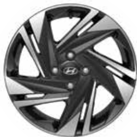
16-inch lichtmetalen velg