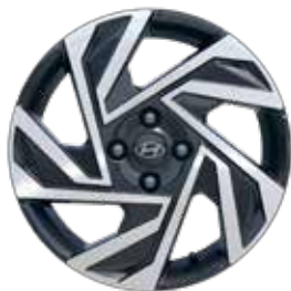
16-inch lichtmetalen velg