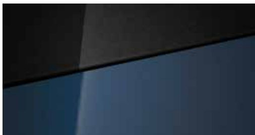
Vibrant Blue Mica + € 795 Vibrant Blue Mica Two-tone Phantom Black + € 995