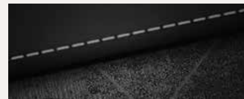
Zwart en grijs, stof (Comfort en Premium)