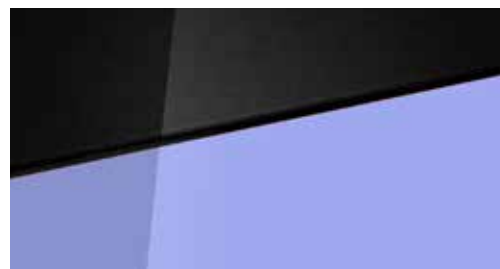
Meta Blue Mica + € 795 Meta Blue Mica Two-tone Phantom Black + € 995