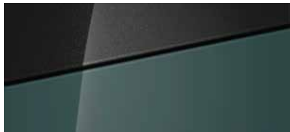
Mangrove Green Mica + € 795 Mangrove Green Mica Two-tone Phantom Black + € 995