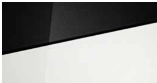
Atlas White Solid Atlas White Solid Two-tone Phantom Black + € 295