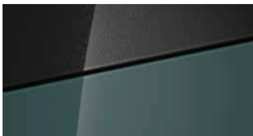
Mangrove Green Mica + € 795 Mangrove Green Mica Two-tone Phantom Black + € 995