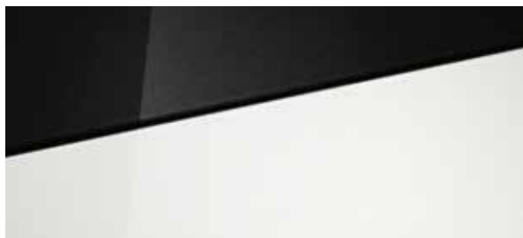
Atlas White Solid Atlas White Solid Two-tone Phantom Black + € 295