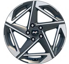
18" kola z lehké slitiny – N Line

www.porovnejhyundai.cz (Porovnejte si vozy Hyundai s konkurencí)