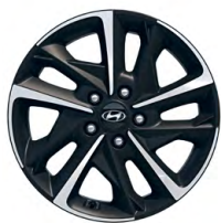
17" kola z lehké slitiny