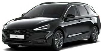
Abyss Black Pearl Perleťová Cena: 16 900 Kč