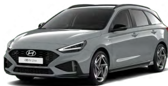
Shadow Gray Pastelová Cena: 16 900 Kč Dostupná pouze pro výbavy N Line