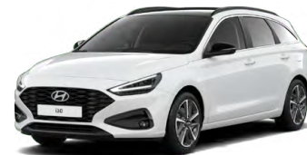
Serenity White Pearl Perleťová Cena: 16 900 Kč