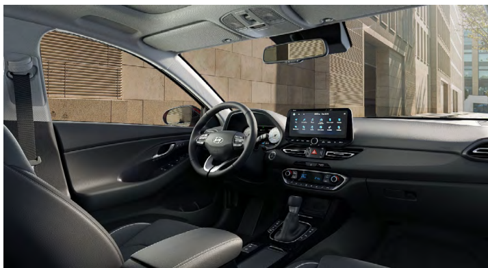
Černý interiér Oceanic Black – látkové čalounění sedadel – světlé čalounění stropu a obložení bočních sloupků – černé provedení přístrojové desky a výplní dveří