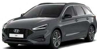
Ecotronic Gray Pearl Perleťová Cena: 16 900 Kč