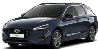
Sailing Blue Pearl Perleťová Cena: 16 900 Kč