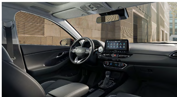
Černý interiér Oceanic Black Premium – kožené čalounění sedadel – černé čalounění stropu a obložení bočních sloupků – světlé čalounění stropu a obložení bočních sloupků – černé provedení přístrojové desky a výplní dveří