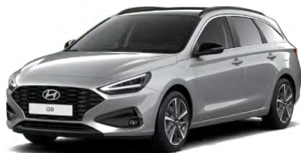
Shimmering Silver Metallic Metalická Cena: 16 900 Kč