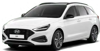
Atlas White Pastelová Cena: 5 900 Kč