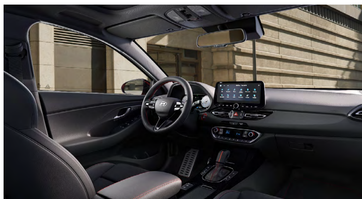
Černý interiér N line Premium – prémiové čalounění v kombinaci kůže/semiš – černé čalounění stropu a obložení bočních sloupků – červeně prošívání sportovní volant, hlavice řadič páky a loketní opěrka