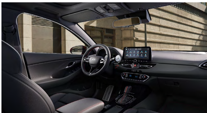
Černý interiér N line – látkové čalounění s červeným prošíváním a logem N – černé čalounění stropu a obložení bočních sloupků – červeně prošívání sportovní volant, hlavice řadič páky a loketní opěrka