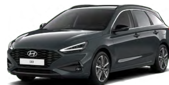
Cypress Green Pearl Perleťová Cena: 16 900 Kč