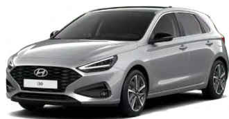
Shimmering Silver Metallic Metalická Cena: 16 900 Kč