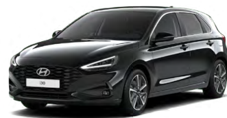
Abyss Black Pearl Perleťová Cena: 16 900 Kč