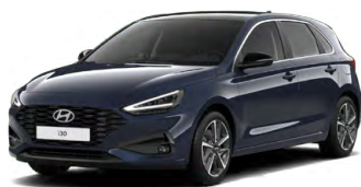
Sailing Blue Pearl Perleťová Cena: 16 900 Kč