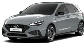
Shadow Gray Pastelová Cena: 16 900 Kč Dostupná pouze pro výbavy N Line