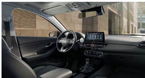
Černý interiér Oceanidis Black – látkové čalounění sedadel – světlé čalounění stropu a obložení bočních sloupků – černé provedení přístrojové desky a výplní dveří