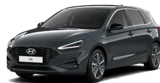
Cypress Green Pearl Perleťová Cena: 16 900 Kč