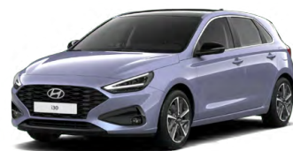
Meta Blue Pearl Perleťová Cena: 16 900 Kč