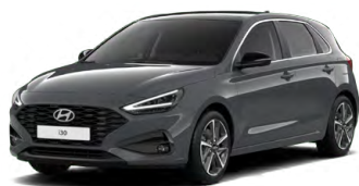
Ecotronic Gray Pearl Perleťová Cena: 16 900 Kč