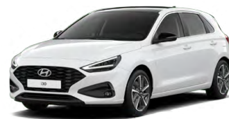
Serenity White Pearl Perleťová Cena: 16 900 Kč