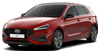
Ultimate Red Metallic Metalická Cena: 16 900 Kč