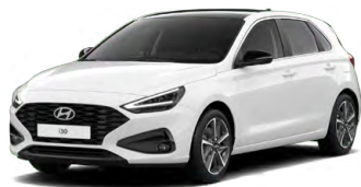
Atlas White Pastelová Cena: 5 900 Kč