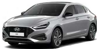
Shimmering Silver Metallic Metalická Cena: 16 900 Kč