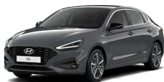
Ecotronic Gray Pearl Perleťová Cena: 16 900 Kč