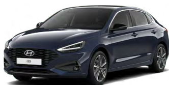
Sailing Blue Pearl Perleťová Cena: 16 900 Kč