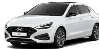
Serenity White Pearl Perleťová Cena: 16 900 Kč