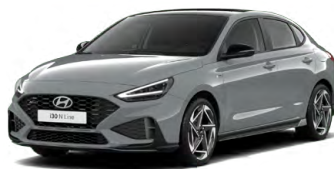
Shadow Gray Pastelová Cena: 16 900 Kč Dostupná pouze pro výbavy N Line