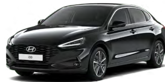
Abyss Black Pearl Perleťová Cena: 16 900 Kč