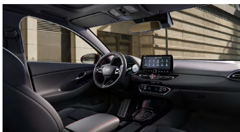
Černý interiér N line Premium – prémiové čalounění v kombinaci kůže/semíř – černé čalounění stropu a obložení bočních sloupků – červeně prošívání sportovní volant, hlavice řadící páky a loketní opěrka