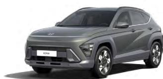
Amazon Gray Metalická Kombinace dostupná také s černým lakováním střechy Cena: 17 900 Kč