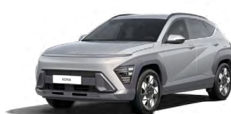
Shimmering Silver Metallic Metalická Kombinace dostupná také s černým lakováním střechy Cena: 17 900 Kč