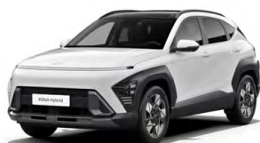
Atlas White Pastelová Kombinace dostupná také s černým lakováním střechy Cena: 9 900 Kč