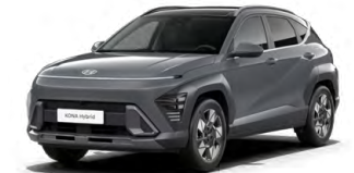
Ecotronic Gray Pearl Perleťová Kombinace dostupná také s černým lakováním střechy Cena: 17 900 Kč