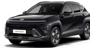
Abyss Black Pearl Perleťová Cena: 17 900 Kč