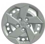
16" ocelová kola s celoplošnými kryty