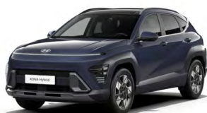
Denim Blue Pearl Perleťová Kombinace dostupná také s černým lakováním střechy Cena: 17 900 Kč