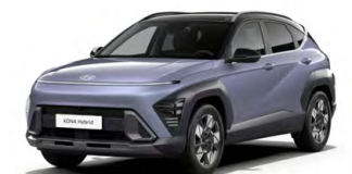
Meta Blue Pearl Perleťová Kombinace dostupná také s černým lakováním střechy Cena: 17 900 Kč