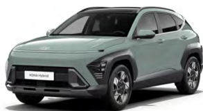
Mirage Green Pastelová Kombinace dostupná také s černým lakováním střechy Cena: 0 Kč