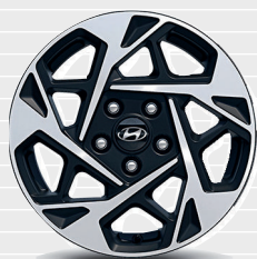
Origo® / Amplia® 205/55 R16