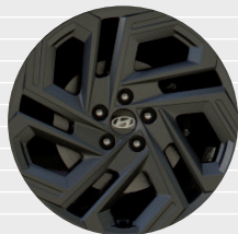
20th Anniversary Edition Cerchi in lega leggera 19" 235/50 R19