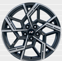
N Line Cerchi in lega leggera 19" 235/50 R19