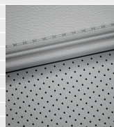
Vertex® Pelle grigia