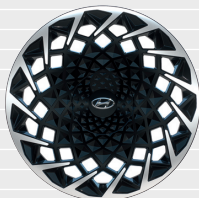
con DESIGN Pack Cerchi in lega leggera 20" Pneumatici 255/45 R20