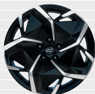
Origo®, Amplia®, Vertex® Cerchi in lega leggera 19" Pneumatici 235/55 R19