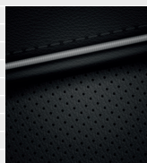
Amplia®, Vertex® Pelle nera