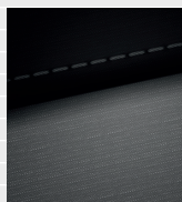
Origo® Tessuto nero