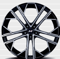
N Cerchi in lega leggera forgiati da 21 pollici 275/35 R21 Pirelli

Set completo di ruote invernali 21 pollici alluminio, "Racing Black"