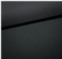
Sedili in stoffa-pelle a secchiello