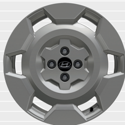
Vertex® Cross Cerchi in lega leggera 17" 205/45 R17