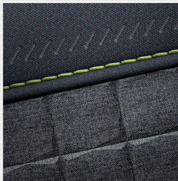
Vertex® Cross Sedili in tessuto grigia