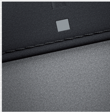
Amplia®, Vertex® Sedili in tessuto nera