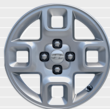
Amplia® Cerchi in lega leggera 15" 185/65 R15