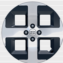
Vertex® Cerchi in lega leggera 17" 205/45 R17