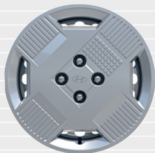
Pica® / Origo® Cerchi in acciaio con copripozzi 15" 185/65 R15