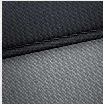
Pica®, Origo® Sedili in tessuto nera