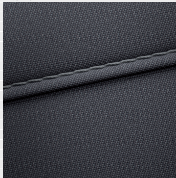
Pica®, Origo® Sedili in tessuto nera