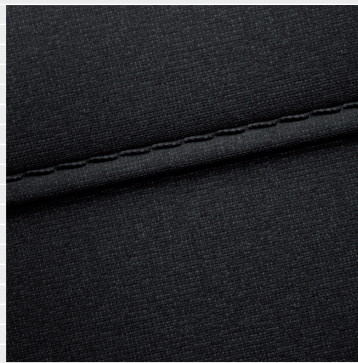
Amplia®, Vertex® Sedili in tessuto nera