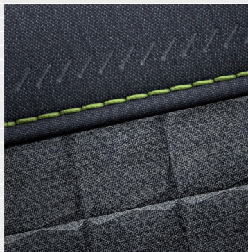
Vertex® Cross Sedili in tessuto grigia