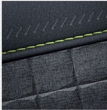
Vertex® Cross Sitze in grauem Stoff