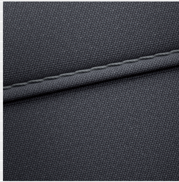
Pica®, Origo® Sitze in schwarzem Stoff