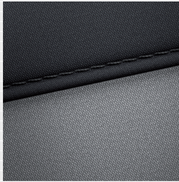
Pica®, Origo® Sitze in schwarzem Stoff