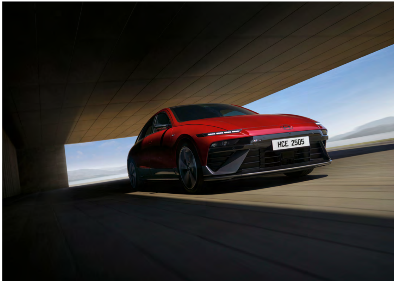
Gonna anteriore esclusiva della N Line.

Il design dinamico ereditato dalla RN22e Rolling Lab e il paraurti ispirato ad un'ala sottolineano le proporzioni sportive della IONIQ 6 N Line.