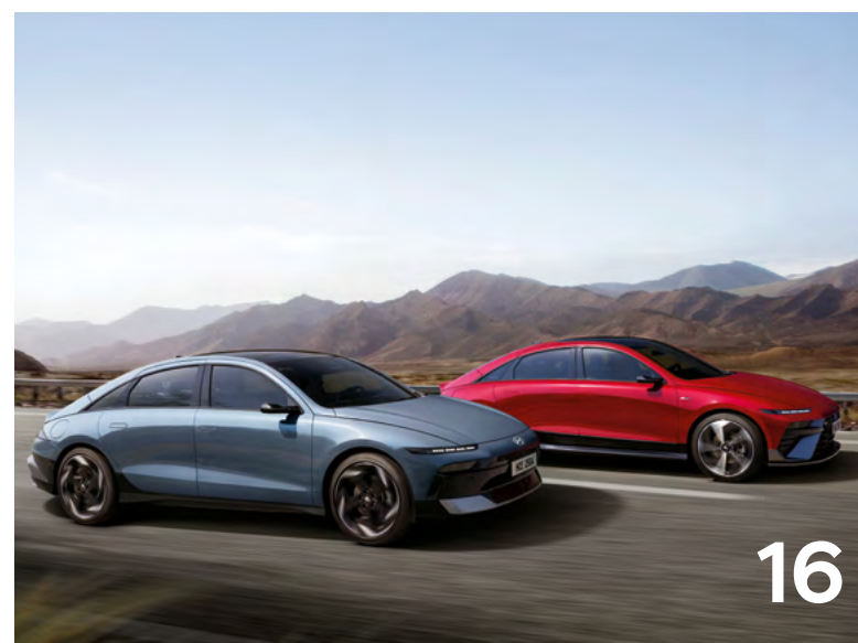
Colori, cerchi, accessori