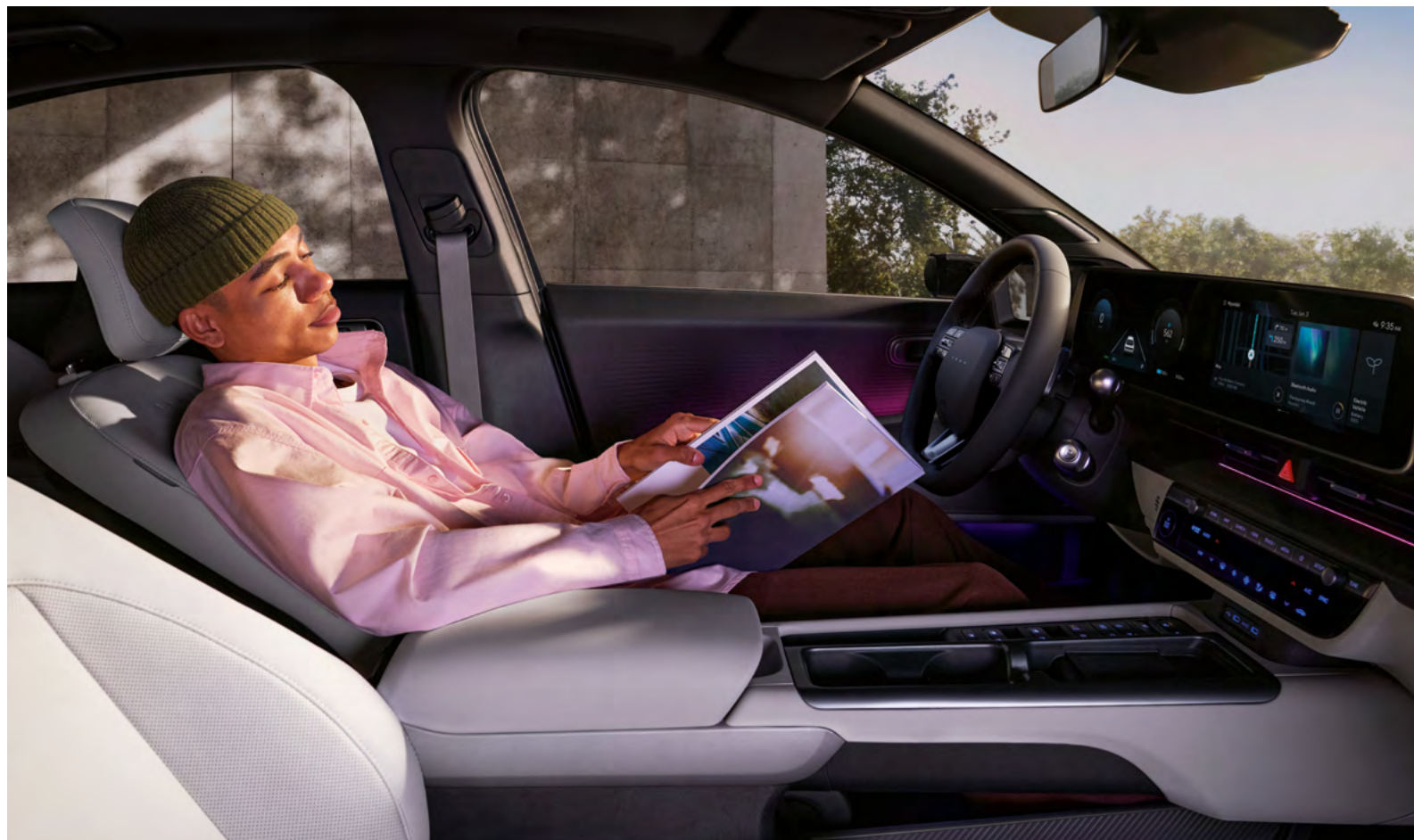
Sedili relax Premium anteriori.

Rilassati in uno spazio ben progettato dove funzionalità intuitive si combinano per semplificare ogni fase del tuo viaggio e offrirti comfort e praticità senza sforzo.