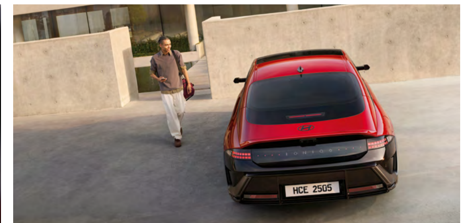
Gonna posteriore sportiva esclusiva N Line.