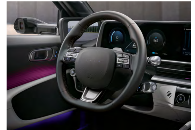
Volante con comandi LED.