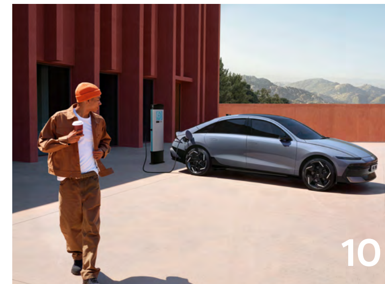
Performance / Ricarica