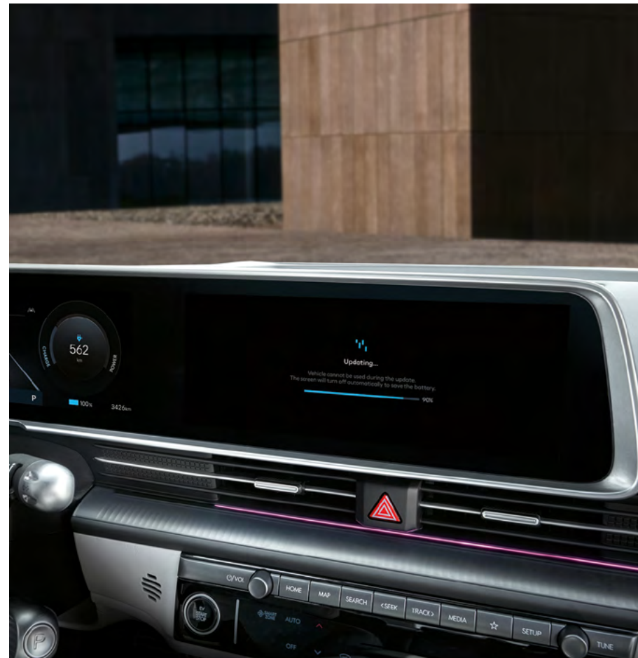
Schermo panoramico da 12,3 pollici.