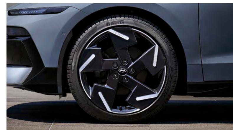
Maniglie delle porte a scomparsa.