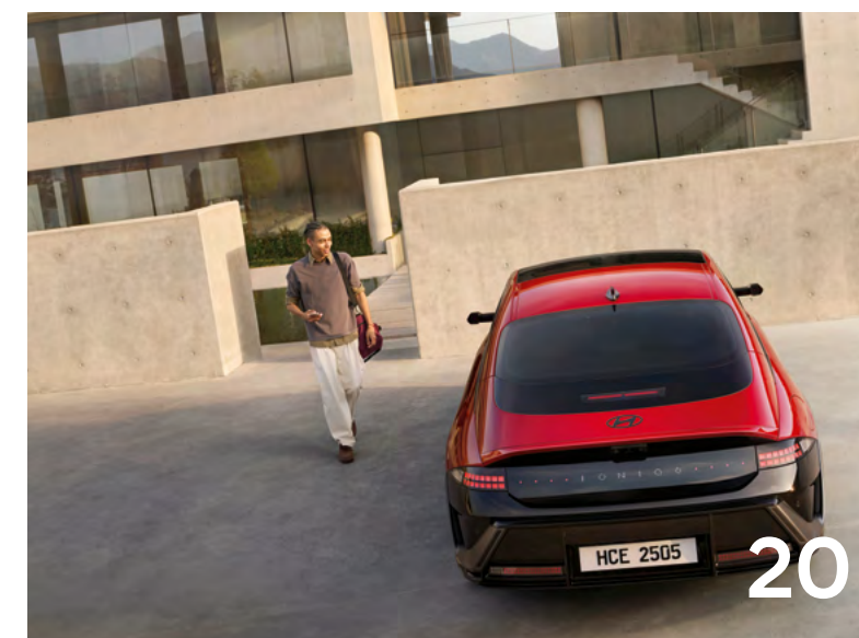
Power your world