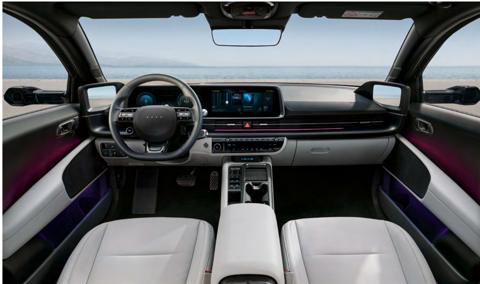
Sedili relax Premium anteriori.

Nuovi interni con materiali di alta qualità, volante ridisegnato e schermo del climatizzatore più grande.