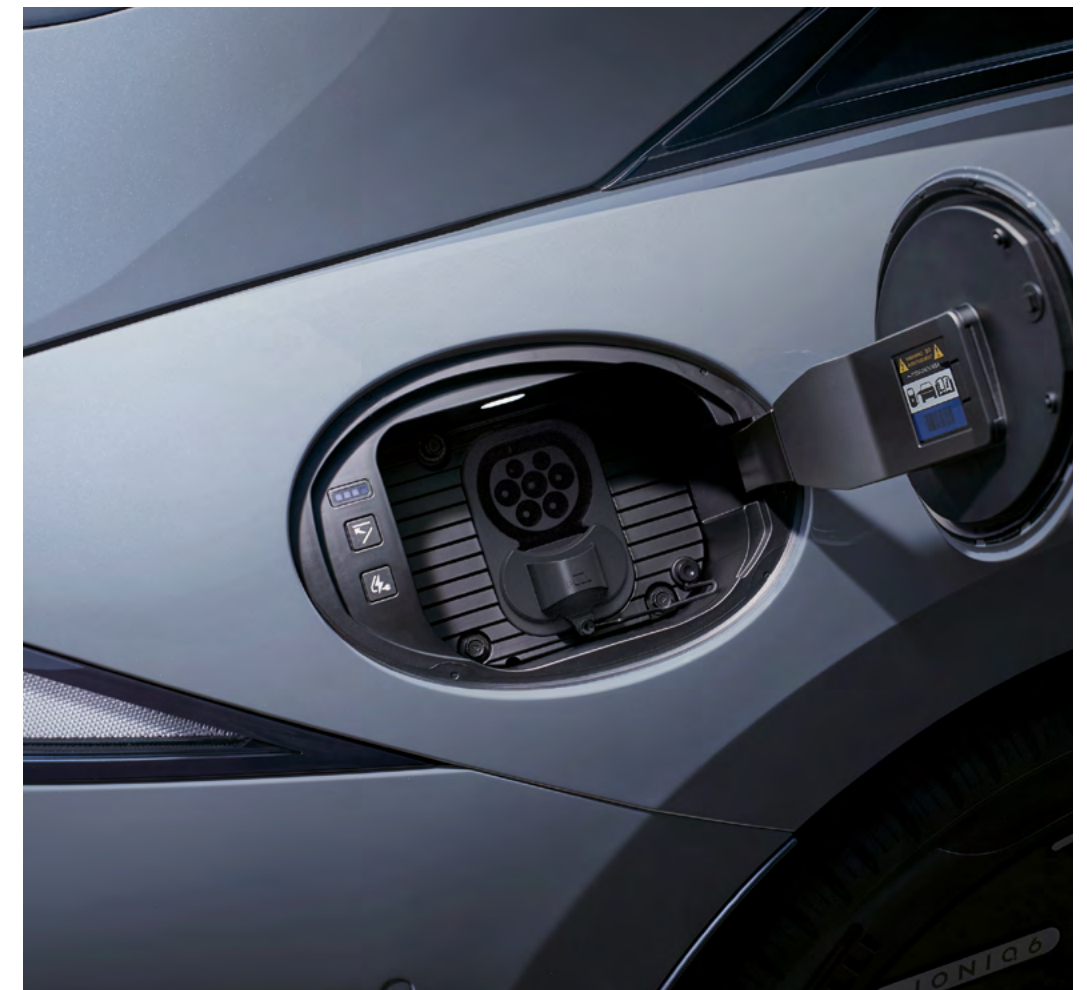
Sportello di ricarica elettrica.

Plug and Charge per una ricarica trasparente e sicura