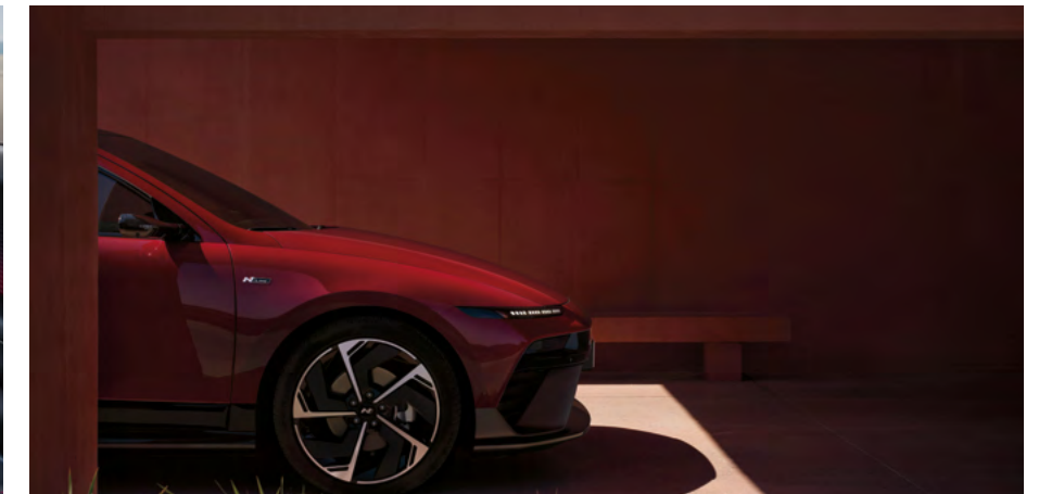
Cerchi esclusivi N Line da 20 pollici.