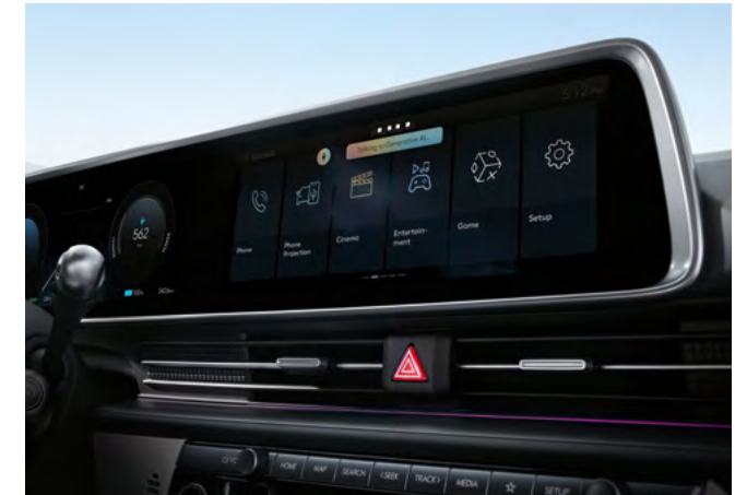
Hyundai AI-Assistent. Over-the-Air-Updates (OTA).