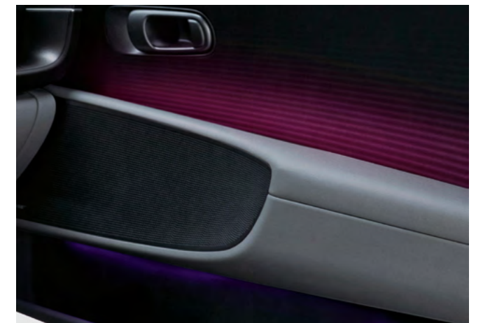
Ambientbeleuchtung (64 Farben).