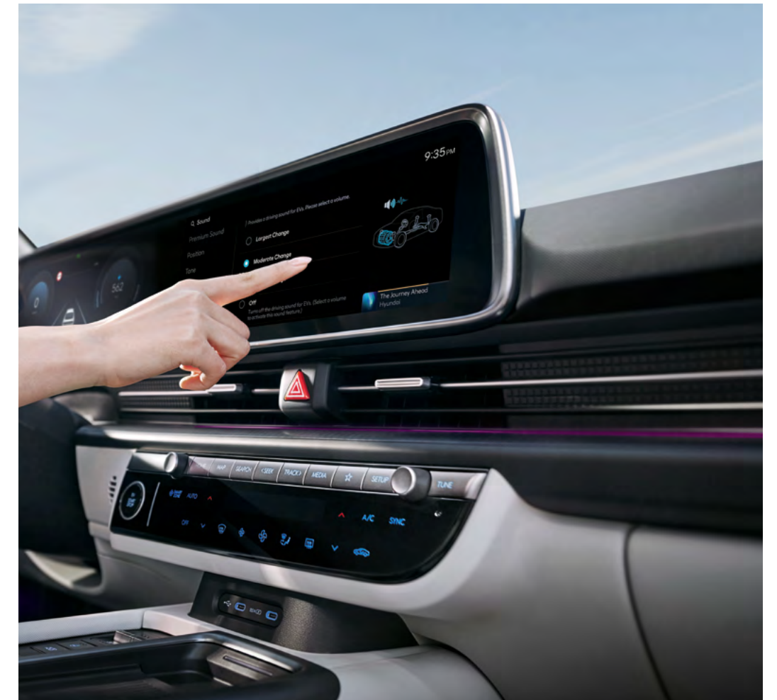
Elektrisches aktives Sounddesign (e-ASD).