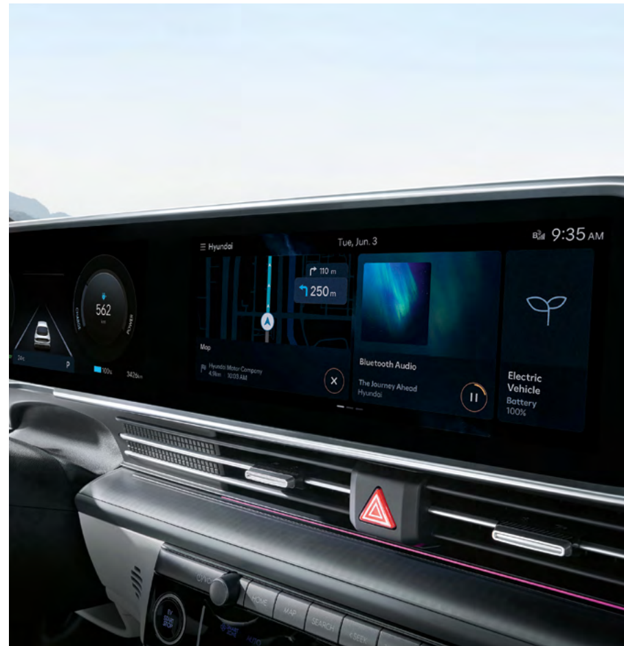
12.3" Panorama Display.