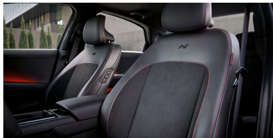
Exklusive N Linie Sportsitze mit N Logo.