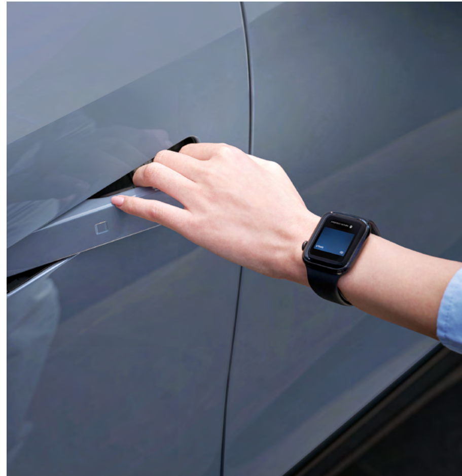
Digital Key 2.0.