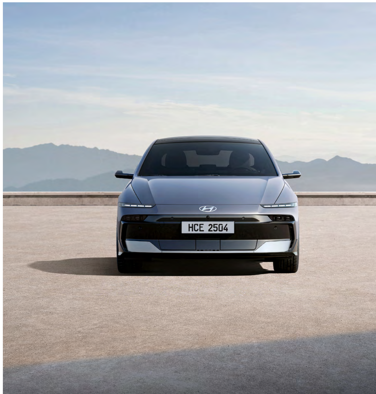
Neu gestaltete Front mit einer dynamischen LED-Signatur.

Horizontale Linien und klare Flächen unterstreichen die breite, dynamische Haltung.