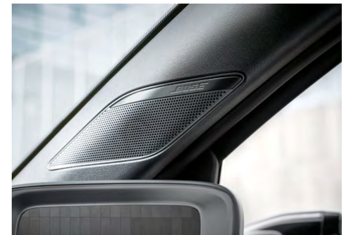
Bose® Premium Sound System.