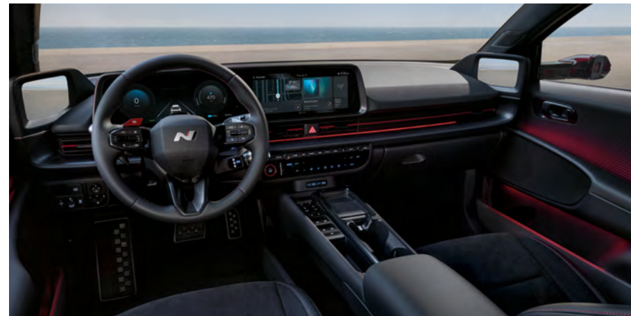
Exklusive N Linie Lenkrad mit N Logo.