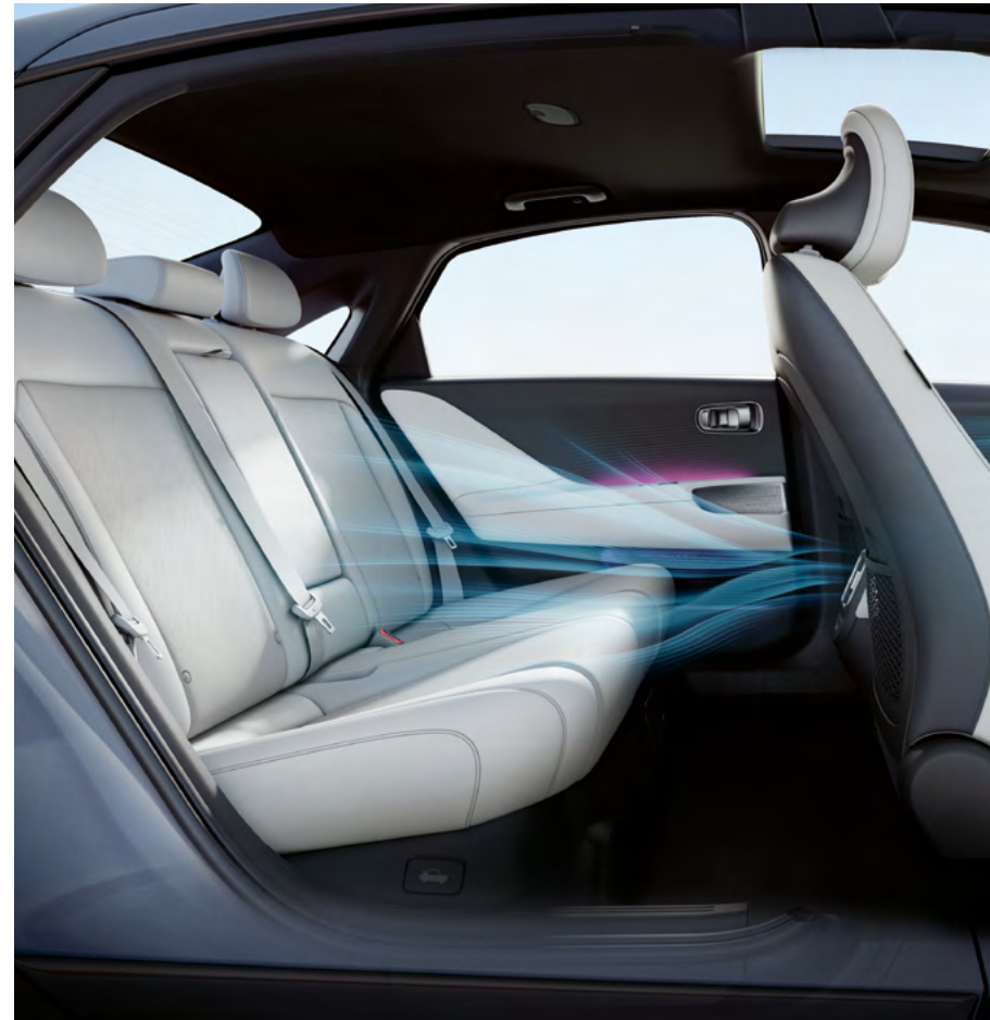
Klimatisierung in der zweiten Reihe.