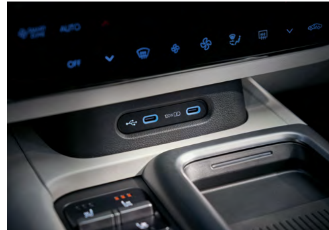
USB-C Anschlüsse vorne. USB-C Anschlüsse hinten.