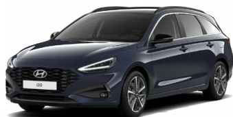
Sailing Blue Pearl Perleťová Cena: 16 900 Kč