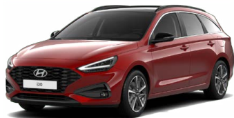
Ultimate Red Metallic Metalická Cena: 16 900 Kč