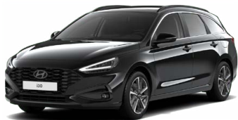
Abyss Black Pearl Perleťová Cena: 16 900 Kč