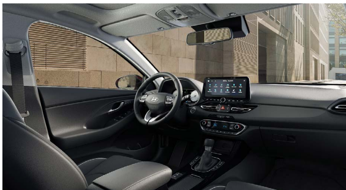
Černý interiér Oceanidis Black – látkové čalounění sedadel – světlé čalounění stropu a obložení bočních sloupků – černé provedení přístrojové desky a výplní dveří