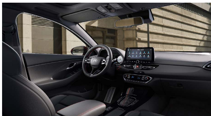
Černý interiér N line Premium – prémiové čalounění v kombinaci kůže/semiš – červeně prošívání sportovní volant, hlavice řadící páky a loketní opěrka