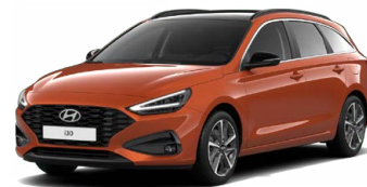
Jupiter Orange Metallic Metalická Cena: 16 900 Kč