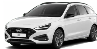
Serenity White Pearl Perleťová Cena: 16 900 Kč