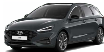
Cypress Green Pearl Perleťová Cena: 16 900 Kč