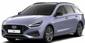
Meta Blue Pearl Perleťová Cena: 16 900 Kč