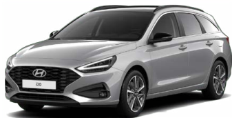
Shimmering Silver Metallic Metalická Cena: 16 900 Kč