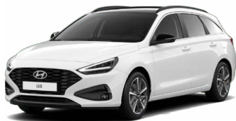
Atlas White Pastelová Cena: 5 900 Kč